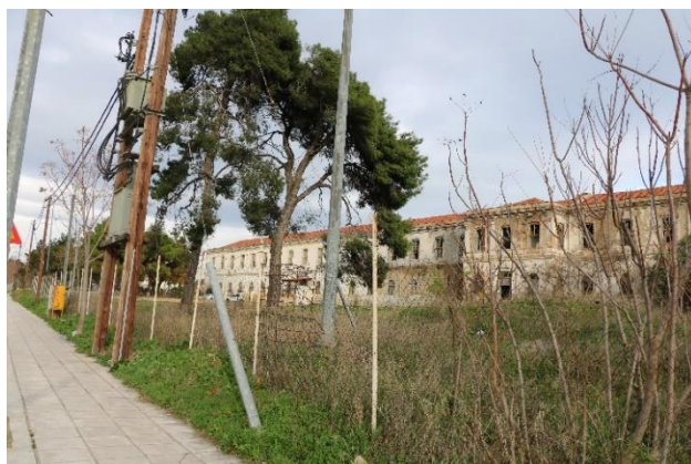
Εικόνα 12: Το κτίριο A2 επί της οδού Λαγκαδά. Στο αριστερό (αποκατεστημένο) τμήμα στεγάζεται η Υπηρεσία Αναπήρων (23/12/2019 -προσωπικό αρχείο)

Στην εισήγησή του ο Γιώργος Αντωνίου 434 επισήμανε τον παιδευτικό ρόλο του Μουσείου, που σε συνδυασμό με το επικείμενο Μουσείο Ολοκαυτώματος, καλείται να παίξει έναν αποφασιστικό ρόλο, κυρίως για τη νέα γενιά, στον αγώνα κατά του ρατσισμού, του νεοναζισμού και του αντισημιτισμού: «Στην ουσία όχι μόνο να τη μορφώσουμε για το παρελθόν, αλλά και να την εξοπλίσουμε για το μέλλον». Τόνισε, επίσης, ότι όσον αφορά σε