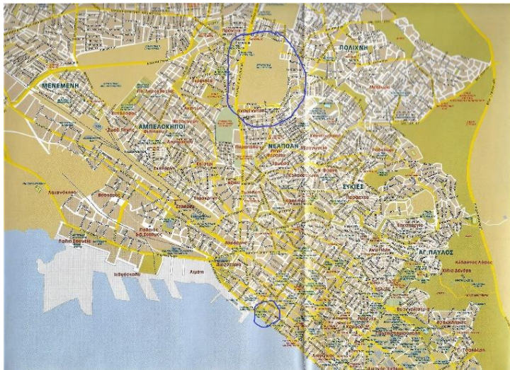
Εικόνα 1: Το στρατόπεδο και η πλατεία σε χάρτη του 2003