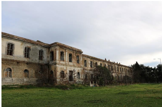
Εικόνα 12: Το κτίριο Α2 με πρόσοψη προς την οδό Λαγκαδά (23/12/2019)

Η οριστική παραχώρηση του πρώην Στρατοπέδου στον ομώνυμο Δήμο πριν από δύο χρόνια άνοιξε το δρόμο, παρ' όλα τα εμπόδια και τις αμφισβητήσεις, στην ίδρυση του Μουσείου Εθνικής Αντίστασης, πάγιο αίτημα Δήμου, πολιτών και οργανώσεων. Για το σκοπό αυτό επιλέχθηκε το κτίριο Α2 (με πρόσοψη επί της οδού Λαγκαδά - εικ. 12, 13), για το οποίο έχει εξασφαλιστεί ήδη η χρηματοδότηση για την ανακατασκευή και ανάπλασή του. 430 Το Α2 θα στεγάσει επίσης και υπηρεσίες του Δήμου, 431 οπότε δεν είναι ξεκάθαρο πόσα τετραγωνικά θα καταλάβει η κάθε χρήση. Το ζήτημα βέβαια που επείγει, πέρα από τις παρεμβάσεις στους ανοιχτούς χώρους, είναι η ιστορική αποκατάσταση του κτιρίου, για την οποία ήδη υπάρχουν μελέτες και προτάσεις. 432