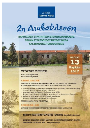
Εικόνα 11: Η αφίσα της 2ης Διαβούλευσης.

στρεμμάτων, 418 με την τροπολογία να ψηφίζεται τρεις μήνες αργότερα. 419 Με την ολοκλήρωση των διαδικασιών παραχώρησης, ο δήμος εγκαινίασε την πολιτική της δημόσιας διαβούλευσης σε δύο παρουσιάσεις - εισηγήσεις 420 των στρατηγικών στόχων της ανάπλασης. Σε αυτές προβλεπόταν η συμμετοχή τόσο επίσημων φορέων όσο και απλών πολιτών, οι οποίοι κλήθηκαν να καταθέσουν τις προτάσεις τους και τις θέσεις τους για την καλύτερη αξιοποίηση του χώρου. Κατά την επίσημη παρουσίαση επιβεβαιώθηκε η ανάδειξη του κτιριακού αποθέματος και η δέσμευση για τη δημιουργία Μουσείου Εθνικής Αντίστασης που αποτελεί και τον τρίτο πυλώνα