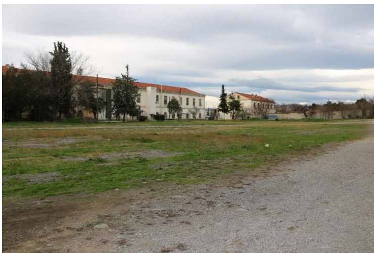
Εικόνα 4: Η εσωτερική ορθογώνια πλατεία συγκέντρωσης (23/12/2019)

Στον ίδιο χώρο, όπως προκύπτει από το φωτογραφικό αρχείο του γαλλικού στρατού, στρατοπέδευε και η γαλλική συμμαχική στρατιά (1915-1917), κατά το διάστημα της εμπλοκής της Ελλάδας στον Α'ΠΠ, ενώ, καθώς αυξάνονταν τα προσφυγικά κύματα μέχρι και το 1922, άρχισαν να δημιουργούνται και οι πρώτοι προσφυγικοί καταυλισμοί γύρω από το στρατόπεδο. 72