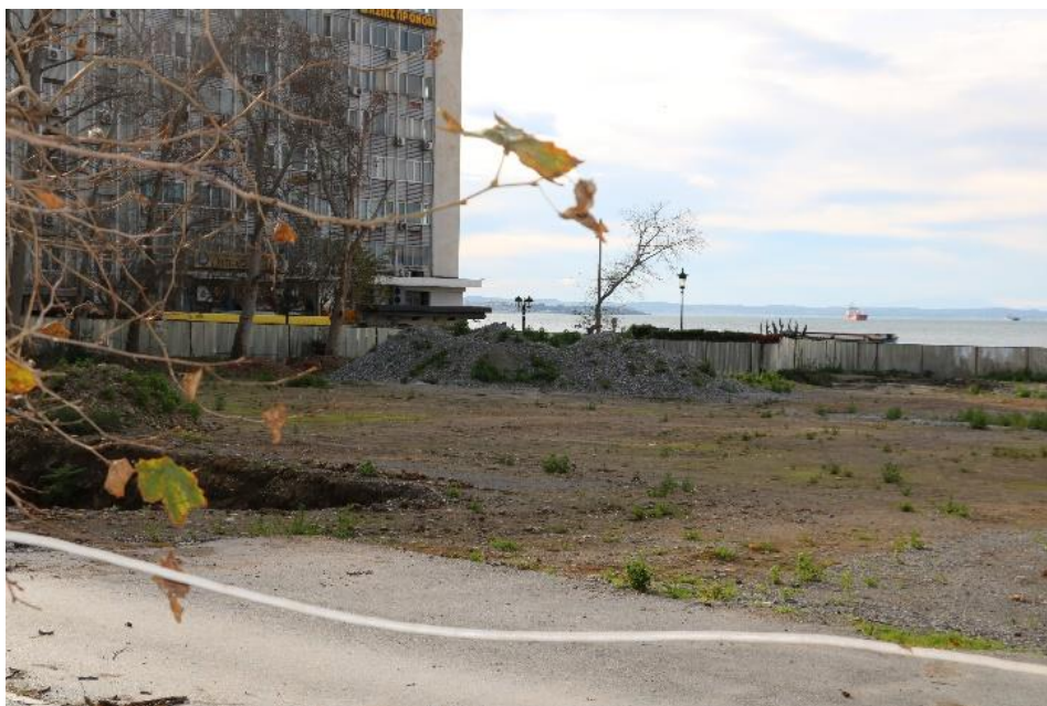
Εικόνα 9: Η εικόνα της πλατείας στις 24/12/2019. Στο μέτωπο προς τη θάλασσα και πίσω από την περίφραξη διακρίνεται το Μνημείο του Ολοκαυτώματος

εξελιξείς αυτές θέτουν εν αμφιβόλω την υλοποίηση της υφιστάμενης μελέτης εντός του 2020. Αν προστεθούν ζητήματα που πιθανότατα θα προκύψουν από τις σωστικές ανασκαφές, καθώς και αυτά της χρηματοδότησης μιας νέας μελέτης και κατασκευής - κυρίως του υπόγειου πάρκινγκ-, τότε μπορούμε με ασφάλεια να θεωρήσουμε ότι η ανάπλαση εισέρχεται σε μια νέα φάση με άδηλο μέλλον.