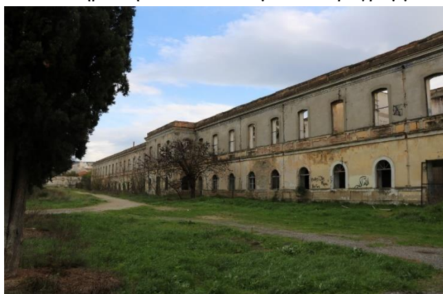
Εικόνα 2: Το κτίριο A3 με πρόσοψη στην πλατεία (23/12/2019)

Η ολοκλήρωση του οικοδομικού προγράμματος τοποθετείται στα 1905. Τα κύρια