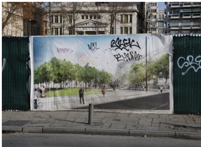
Εικόνα 8: Η αφίσα φωτορεαλιστικής αναπαράστασης της πλατείας με το μνημείο Ολοκαυτώματος (24/12/2019)

Ωστόσο, το ζήτημα πλέον φαίνεται να απομακρύνεται από την ανάγκη της ανάδειξης της πλατείας ως μνημονικού τόπου των εβραίων της Θεσσαλονίκης. Σύμφωνα με τα τελευταία δημοσιεύματα του τύπου 231 παρατηρείται στασιμότητα ως προς την εξέλιξη των έργων (εικ.9), ενώ επανέρχεται και η ιδέα της κατασκευής υπόγειου χώρου στάθμευσης, που θα προηγηθεί κατασκευαστικά σε σχέση με την ανάπλαση της πλατείας. Οι