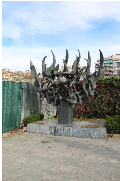
Εικόνα 6: Το μνημείο Ολοκαυτώματος στην περιφραγμένη πλατεία Ελευθερίας (24/12/2019)

Την ώρα που γράφονται αυτές οι γραμμές ο χώρος είναι περιφραγμένος – εκτός του Μνημείου του Ολοκαυτώματος, το οποίο είναι ορατό και προσβάσιμο (εικ.6)- και έχουν ξεκινήσει κάποιες από τις προβλεπόμενες εργασίες. 229 Στην πλευρά που συναντάει την οδό Μητροπόλεως έχει τοποθετηθεί ένας δίγλωσσος «Δείκτης μνήμης» (εικ.7) της πλατείας, στον οποίο παρέχονται πληροφορίες για το ιστορικό της, συμπεριλαμβανομένου του «Μαύρου Σαββάτου», χωρίς ωστόσο να κυριαρχεί στην ιστορική αφήγηση. 230 Σε κάθε μία από τις 4 πλευρές της πλατείας και πάνω στην εργοταξιακή περίφραξη έχουν τοποθετηθεί αφίσες φωτορεαλιστικής αναπαράστασης, που απεικονίζουν τη συγκεκριμένη μελλοντική όψη της.