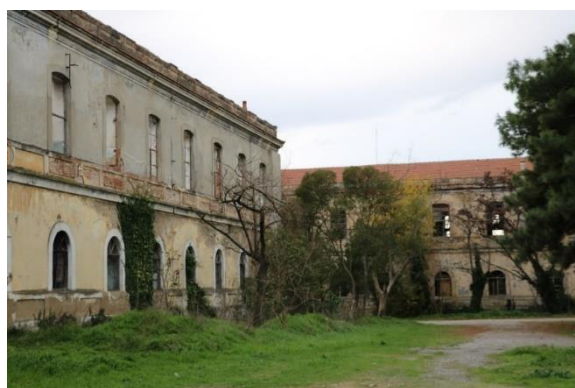
Εικόνα 3: Η γωνιακή σύγκλιση των κτιρίων A3-A2 με μέτωπο στην πλατεία (23/12/2019: προσωπικό αρχείο)

αυτό -εικ.3) ώστε να σχηματίζουν μια ορθογώνια εσωτερική πλατεία (εικ.4), στην οποία προφανώς γίνονταν οι παρατάξεις του τουρκικού στρατού. Συμπληρωματικά ως προς τα κεντρικά κτίρια οικοδομήθηκαν ένα μικρό κτίριο για τις διοικητικές υπηρεσίες (ταξιαρχία), 4 στάβλοι για τα άλογα του ιππικού αλλά και ένα ισλαμικό τέμενος (τζαμί) 70 για τις θρησκευτικές ανάγκες των