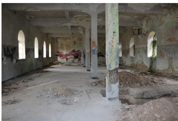
Εικόνα 10: Το εσωτερικό του κτιρίου Α2 (23/12/2019)

πολιτικής ηγεσίας για την οριστική μεταβίβαση του χώρου στην τοπική δημοτική αρχή, η απουσία φύλαξης, η έλλειψη συντήρησης αλλά και τα αντικρουόμενα συμφέροντα – στρατού, εκκλησίας, δήμου, οικονομικών παραγόντων, κοινωνικών, περιβαλλοντικών και πολιτικών κινημάτων- όσον αφορά στις διεκδικούμενες εκτάσεις και στις χρήσεις των ανοιχτών και δομημένων χώρων, είχαν ως αποτέλεσμα την ουσιαστική εγκατάλειψη του πρώην στρατοπέδου. Τα κτίρια βανδαλίστηκαν και λεηλατήθηκαν σε βαθμό απόλυτης απογύμνωσης των οικοδομικών υλικών τους. Κουφώματα, καλώδια, μεταλλικά μέρη, κεραμίδια και οτιδήποτε αποτελούσε συστατικό στοιχείο ενός δομημένου χώρου αφαιρέθηκαν μετατρέποντας τα κτίρια –συμπεριλαμβανομένων και αυτών που είχαν χαρακτηριστεί το 2003 ως διατηρητέα- σε «κουφάρια» (εικ.10). Ανοιχτοί και στεγασμένοι χώροι έγιναν μάρτυρες πάσης φύσεως δραστηριοτήτων, από περιπάτους των περιοίκων και στέκι διαφόρων κοινωνικών ομάδων μέχρι τύπος έκνομων ενεργειών, όπως η υλοτόμηση των δέντρων ή άλλων βαρύτερων παραβατικών συμπεριφορών. Βαρύτατο πλήγμα δέχτηκαν τα δομικά μέρη κτιρίων από περιστατικά διαδοχικών πυρκαγιών –2010, το 2011 δύο πυρκαγιές 400 και μία το 2013 - 401 που τα κατέστρεψαν ολοσχερώς.