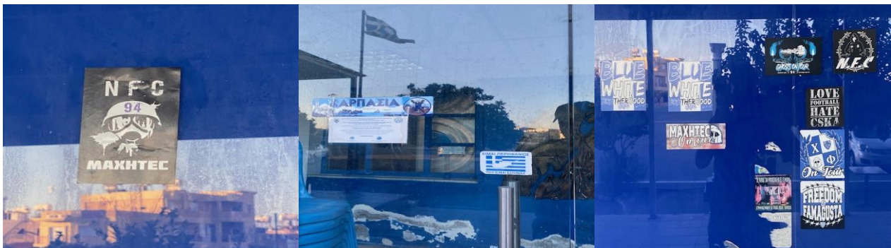
(φωτογραφίες που έβγαλα κατά την επίσκεψη μου στο περιβάλλοντα χώρο του σταδίου Αντώνης Παπαδόπουλος τον Νοέμβριο του 2022)

Όπως αναφέρεται στη βιβλιογραφία «βασικό κριτήριο για την επιλογή μιας ομάδας είναι η τοπικότητα, δηλαδή του να επιλέγουν την ομάδα μιας πόλης ή περιοχής που αποτελεί στοιχείο αυτοπροσδιορισμού και αλληλοαναγνώρισης δηλαδή συνιστά στοιχείο της ταυτότητας (Κυπριανός & Χουμεριανός, 2009:123). Αντίθετα όμως όπως είδαμε παραπάνω οι οργανωμένοι οπαδοί της Ανόρθωσης Αμμοχώστου δεν αποδέχονται τον όρο τοπικιστές ως προσδιορισμό για τους ίδιους, καθώς οι αξίες τους πηγάζουν από το έθνος που δεν επιδέχεται τοπικιστικό προσδιορισμό αλλά οικουμενικό όπου υπάρχουν Έλληνες στο κόσμο. Ποιο αναλυτικά σύμφωνα με τη βιβλιογραφία η κοινωνική έρευνα αναλύει την εμφάνιση των οργανωμένων οπαδών ως «ενός δυναμικού και διεκδικητικού κινήματος που αντανάκλαται στη παρουσία στηλών στις εφημερίδες και τα έντυπα της εποχής με κύριο χαρακτηριστικό το να υπενθυμίζουν τις δραστηριότητες των συνδέσμων και να ασκούν κριτική στις αποφάσεις της διοίκησης και την ανάδειξη των αγωνιστικών επιτευγμάτων της ομάδας» (Τζούκας, 2013:262).