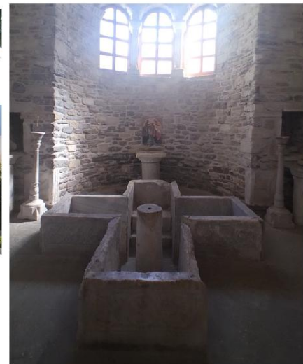
Εικ. 6: Εκατονταπυλιανή Πάρου - Κολυμπύθρα σε σχήμα σταυρού από το παλαιοχριστιανικό βαπτιστήριο.