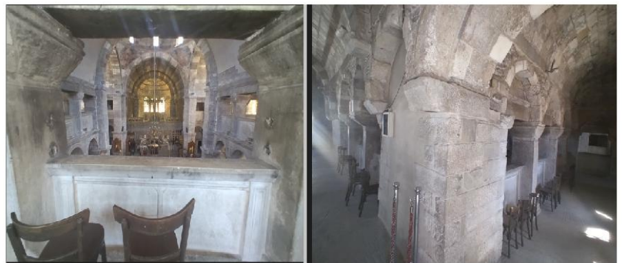
Εικ. 8 και 9: Εκατονταπυλιανή Πάρου - Υπερώα