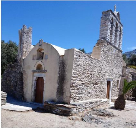
Εικ. 20 : Παναγία Δροσιανή Νάξος