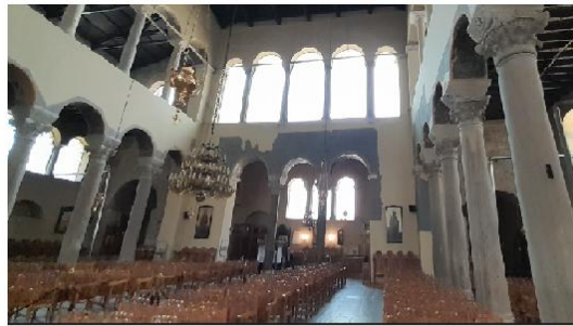
Εικ. 14: Αχειροποίητος Θεσ/κης - Κίονες χωρίζουν τον ναό σε τρία κλίτη