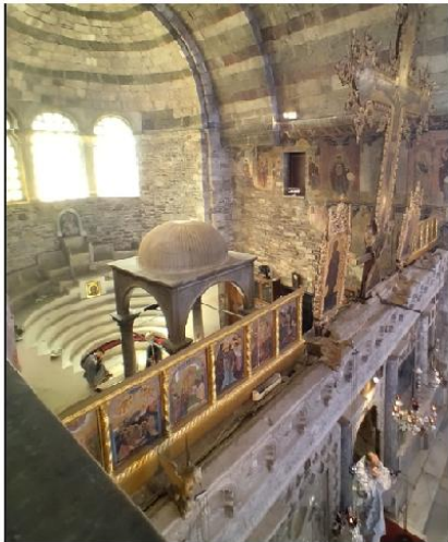
Εικ. 13: Ι.Ν. Εκατονταφυλιανής - Διακρίνεται το παράθυρο από το μυτατώριο