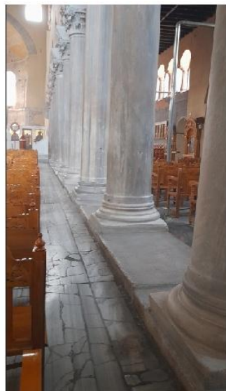
Εικ. 17: Αχειροποίητος Θεσ/κη - Στυλοβάτης