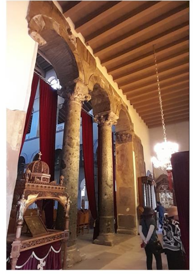
Εικ. 3: Ναός Αγ. Δημητρίου Θεσ/κης - Τρίβηλο