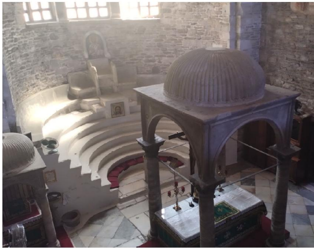
Εικ. 4: Εκατονταπυλιανή Πάρου - Σύνθρονο και κιβώριο