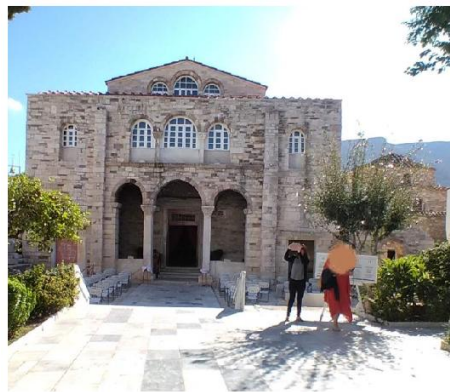
Εικ. 5: Εκατονταπυλιανή Πάρου - Στη βορεινή της πλευρά διακρίνεται το παλαιοχριστιανικό πρόσκτισμα του βαπτιστηρίου.