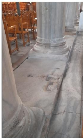
Εικ. 16: Αχειροποίητος Θεσ/κης - Ένδειξη ύπαρξης μεσοκίωνων θωρακίων