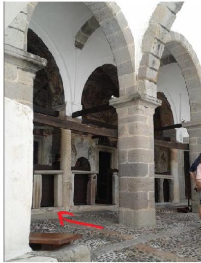
Εικ. 11: Ι.Μ. Αγ. Ιωάννη Θεολόγου Πάτμος - Παλιό φράγμα ιερού σε δεύτερη χρήση