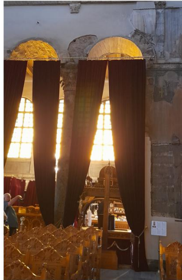
Εικ. 2: Ναός Αγ. Δημητρίου Θεσ/κης - Βήλα στα μετακίονια διαστήματα