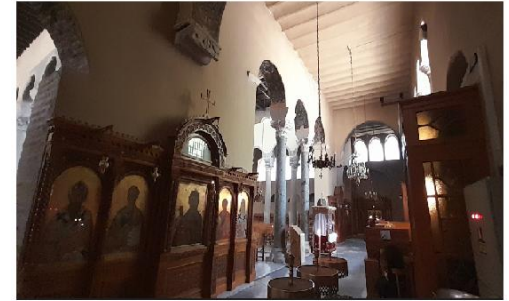
Εικ. 15: Αχειροποίητος - Νάρθηκας με τρίβηλο και πλαϊνές θύρες που οδηγούν στα πλάγια κλίτη