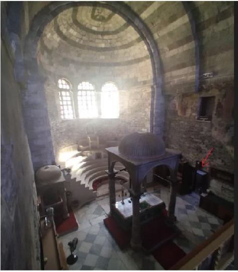
Εικ. 10: Εκατονταφυλιανή Πάρου - Αψίδα του ιερού και εμφανή η διαμόρφωση του τριπλού ιερού. Πλαϊνές θύρες συνδέουν τον χώρο του ιερού Βήματος με τα πλαϊνά διαμερίσματα.