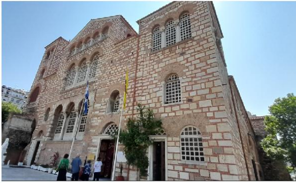
Εικ. 18: Ι.Ν. Αγίου Δημητρίου Θεσ/κης