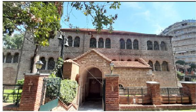
Εικ. 19: Αχειροποίητος Θεσσαλονίκης