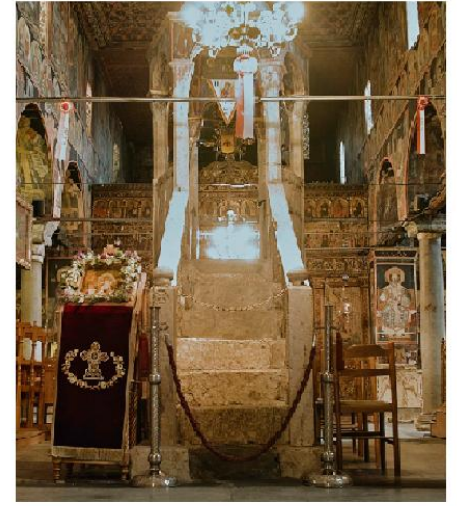
Εικ. 12: Ι.Ν. Κοιμήσεως Θεοτόκου Καλαμπάκας - Άμβωνας