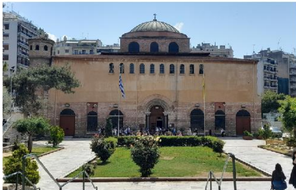
Εικ. 21 : Ι.Ν. Αγίας Σοφίας Θεσσαλονίκης