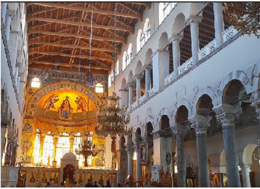
Εικ. 1: Ναός Αγ. Δημητρίου Θεσ/κης - Ξυλόστεγη Βασιλική