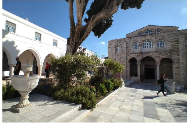
Εικ. 21 : Ι.Ν. Εκατονταπυλιανής Πάρου