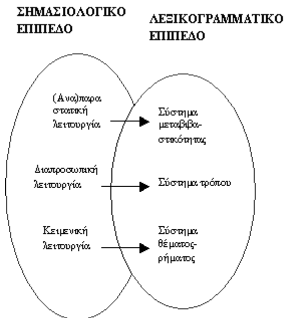
Εικόνα 2: Σχέση σημασιολογικού και λεξικογραμματικού επιπέδου

στη Συστημική Λειτουργική Γραμματική του Halliday