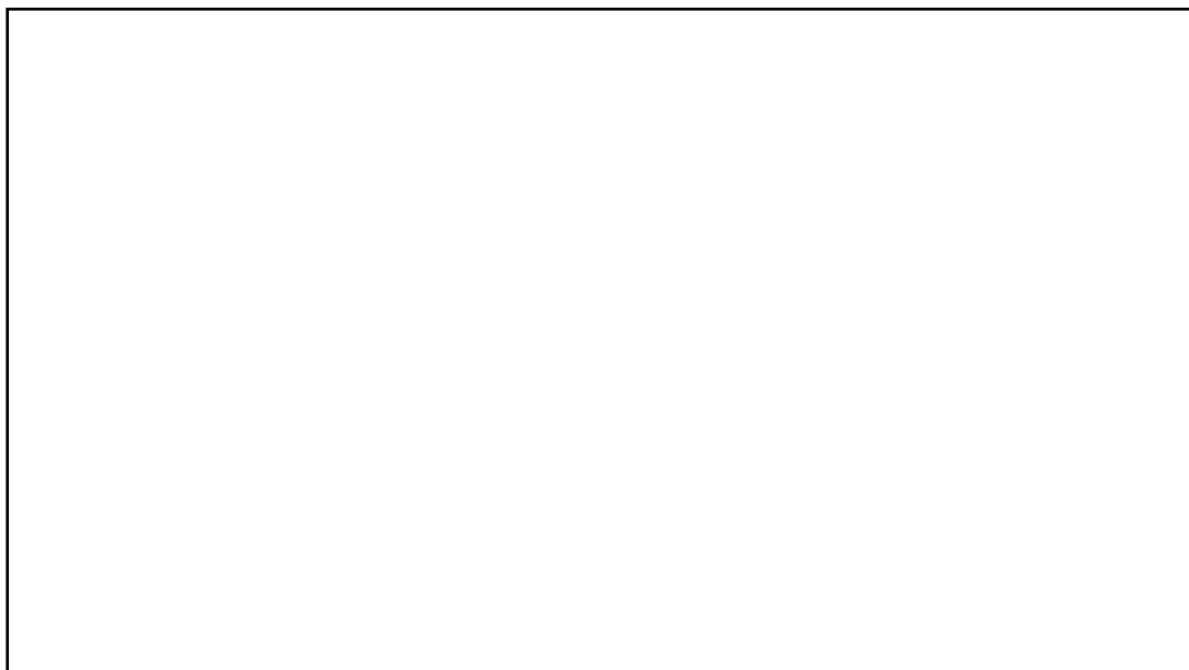
Σχήμα 1: Κατανομή των εκτιμητών ανά φύλο.

Το μεγαλύτερο μέρος των εκτιμητών ήταν γυναίκες καλύπτοντας ποσοστό 90% των συμμετεχόντων (βλέπε Σχήμα 1, σελ. 39).