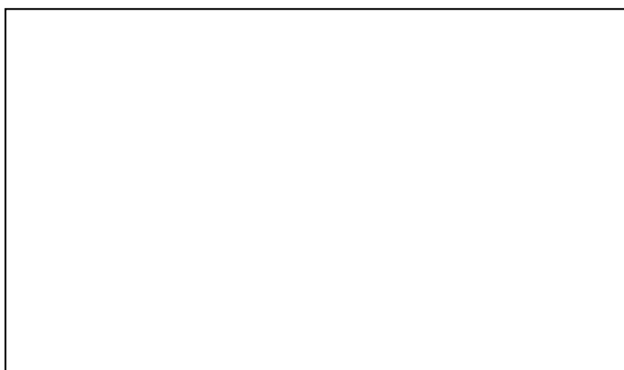
Σχήμα 3: Κατανομή των εκτιμητών με βάση την προϋπηρεσία τους στον ΕΛ.Γ.Α.

Η προϋπηρεσία των εκτιμητών κατηγοριοποιήθηκε από 8 μήνες μέχρι άνω των 32 μηνών. Πιο αναλυτικά το 25% αυτών δήλωσε πως εργάστηκε για ένα 8μηνο, το 20% δήλωσε ότι εργάστηκε από 8 έως και 12 μήνες, το 20% από 12 έως και 24 μήνες, το 10% από 24 έως και 32 μήνες και το 20% πάνω από 32 μήνες. Επιπλέον, ένας εκτιμητής (ποσοστό 5%) δήλωσε πως υπήρξε συμβασιούχος εκτιμητής κατά το παρελθόν χωρίς να διευκρινίζει τη χρονική διάρκεια (βλέπε Σχήμα 3, σελ. 40).