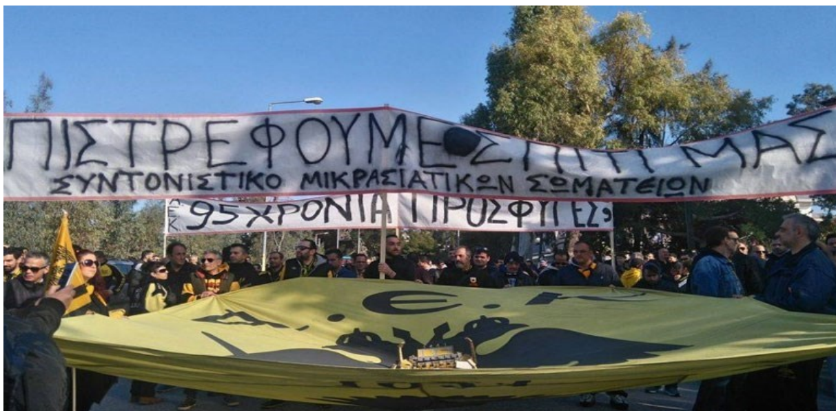
Εικόνα 8: Επιστρέφουμε σπίτι μας, Συντονιστικό Μικρασιατικό Σωματείο. Πορεία διαμαρτυρίας οργανωμένων οπαδών Α.Ε.Κ. και Μικρασιατικών συλλογικοτήτων κατά του Δήμου Νέας Φιλαδέλφειας. 10