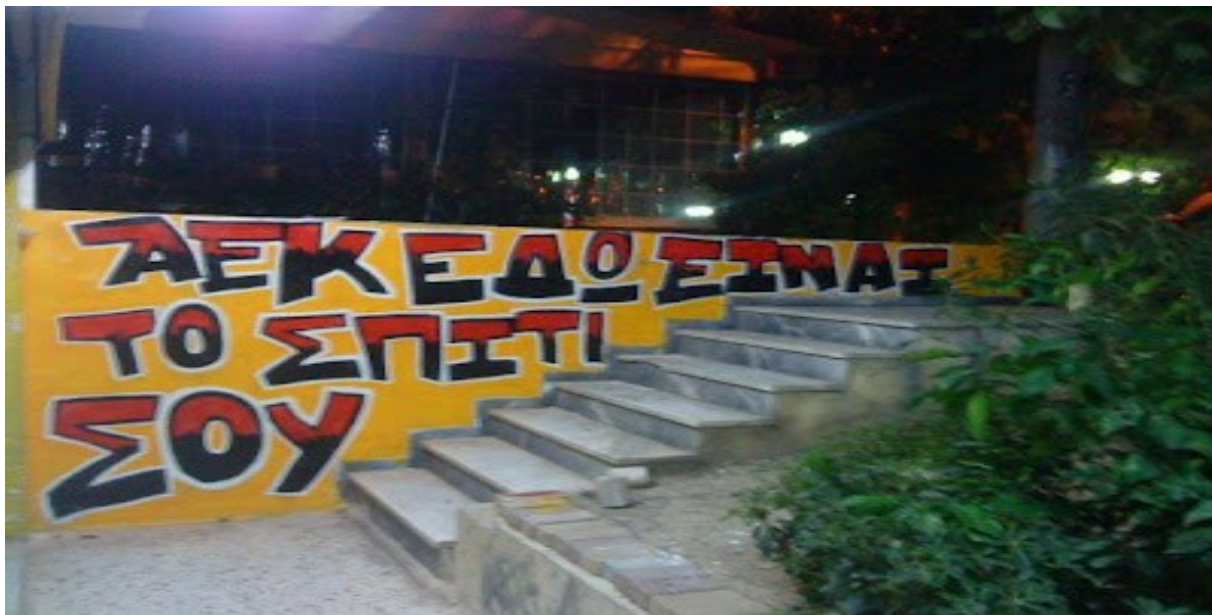
Εικόνα 4: ΑΕΚ εδώ είναι το σπίτι σου. Τοιχογραφία παλαιού συνδέσμου της Original21 στην περιοχή της Νέας Φιλαδέλφειας 6