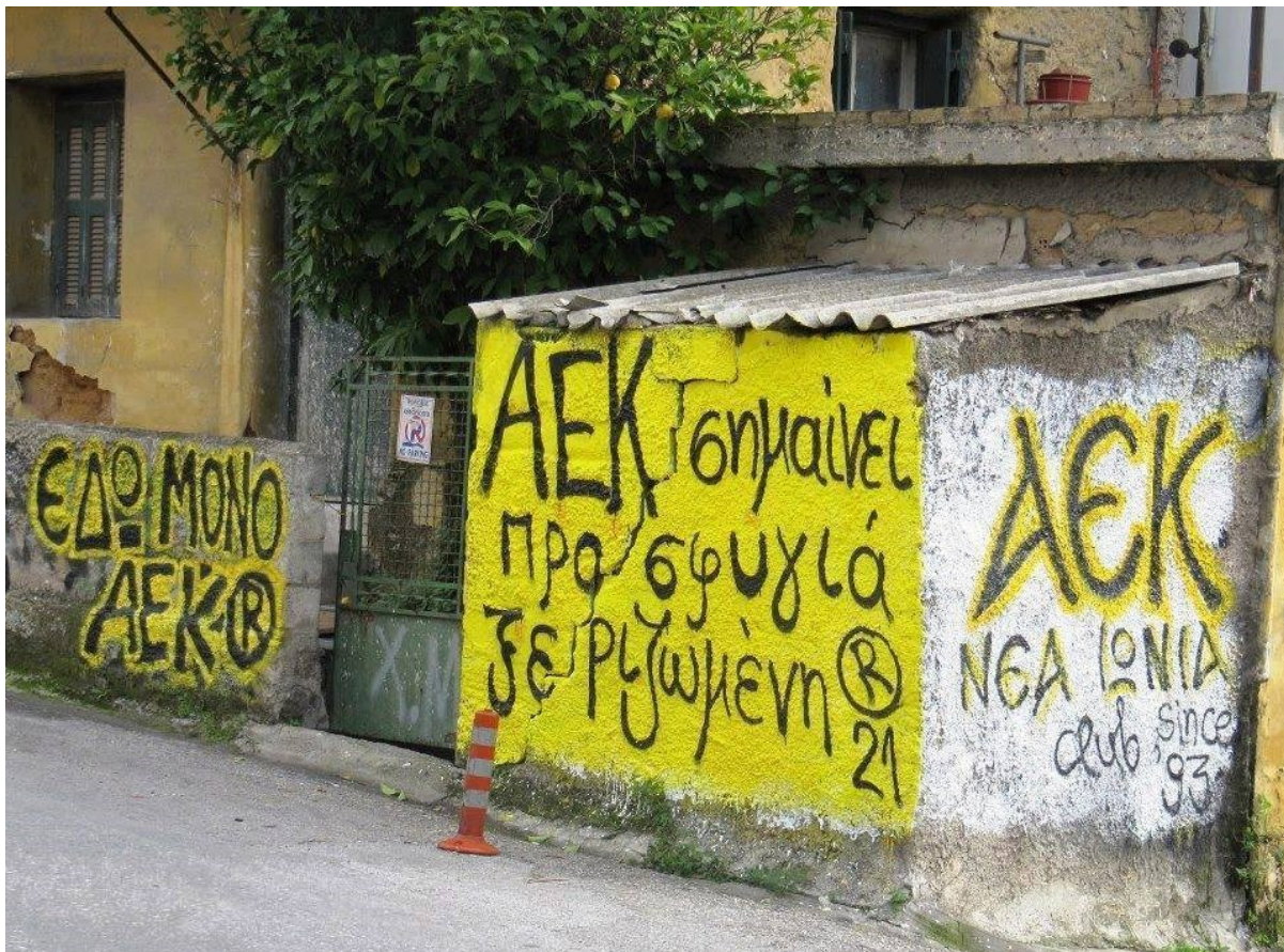
Εικόνα 1: ΑΕΚ σημαίνει προσφυγιά ξεριζωμένη. Εμβληματική τοιχογραφία στην περιοχή της Νέας Ιωνίας 1