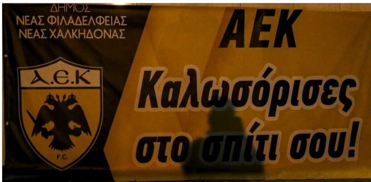
Εικόνα 10: ΑΕΚ Καλωσόρισες στο σπίτι σου. Πανό του Δήμου Νέας Φιλαδέλφειας - Νέας Χαλκηδόνας κατά τα εγκαίνια του νέου γηπέδου της Α.Ε.Κ. στην περιοχή. 12

Η διαμόρφωση της προσφυγικής μνήμης εντός των οπαδικών ταυτοτήτων αποτέλεσε μέσο διαφήμισης και προώθησης με σκοπό να ελκύσει υποστηρικτές ή και να ενισχύσει την αναγνωρισιμότητα του συλλόγου στο εθνικό και διεθνές επίπεδο. Ακόμη, η διαμόρφωση της προσφυγικής ταυτότητας εξυπηρέτησε και ευρύτερα κοινωνικά συμφέροντα, όπως η ανάδειξη και η προώθηση της ιστορίας και του πολιτισμού μιας κοινότητας. Αυτό είχε ως αποτέλεσμα στη διατήρηση της μνήμης και της κληρονομιάς της κοινότητας και στη δημιουργία συναισθηματικών δεσμών εντός του κοινωνικού συνόλου.