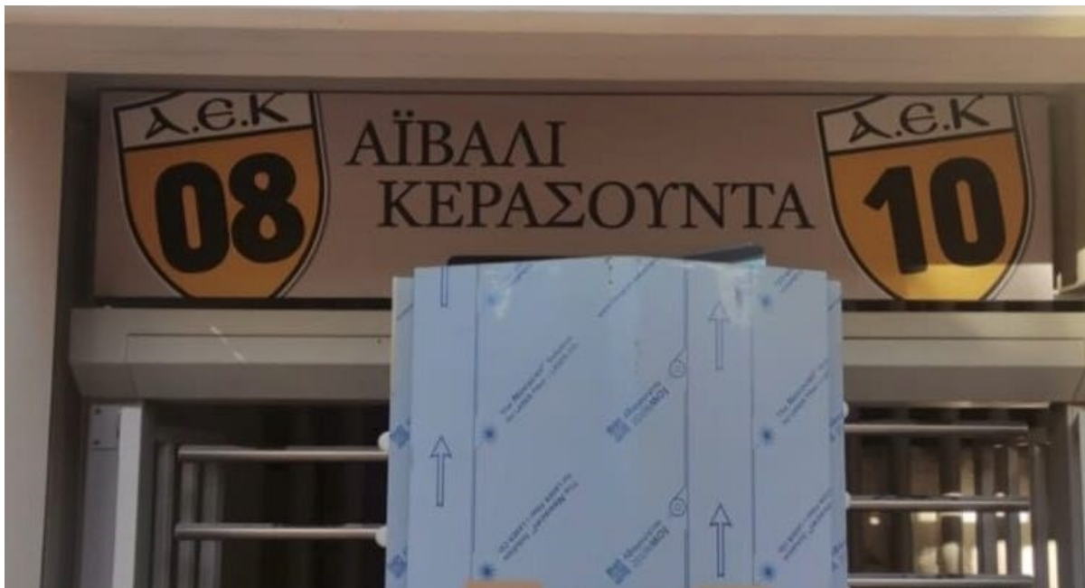
Εικόνα 15: Αϊβαλί – Κερασούντα. Είσοδος Γηπέδου Α.Ε.Κ. Κάθε θύρα και ένα όνομα πόλης ελληνισμού πριν τον ξεριζωμό. 17