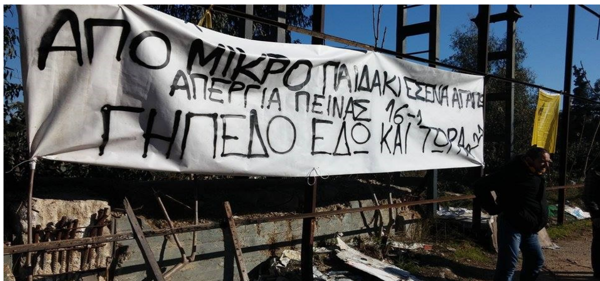
Εικόνα 6: «Από μικρό παιδάκι εσένα αγαπάω. Απεργία Πείνας 16-1. Γήπεδο εδώ και τώρα. R21». 8

Ο δυναμικός και μαζικός χαρακτήρας των κινητοποιήσεων για το δίκαιο αίτημα του συλλόγου για την επιστροφή στην έδρα που μεγαλούργησε κατά τα προηγούμενα χρόνια, επέφερε αποτελέσματα, επιβεβαιώνοντας έτσι σε μεγάλο βαθμό, την σημαντική επίδραση με έντονους συναισθηματικούς δεσμούς και δυναμική που κατέχει ο αθλητικός σύλλογος της Α.Ε.Κ. και ο οπαδικός πυρήνας της με την περιοχή της Νέας Φιλαδέλφειας. Το νέο στάδιο της Α.Ε.Κ. δεν αποτέλεσε απλά ένα σύγχρονο αθλητικό κέντρο, θεωρήθηκε ένα τοπόσημο που άλλαξε δυναμικά την ευρύτερη περιοχή της Νέας Φιλαδέλφειας, χωρίς να χάσουν οι γειτονιές της τα ποιοτικά χαρακτηριστικά τους.