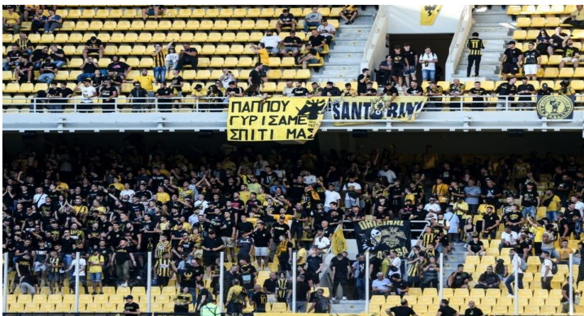
Εικόνα 12: Παππού Γυρίσαμε Σπίτι μας. Το πρώτο πανό που υψώθηκε στο νέο γήπεδο της Α.Ε.Κ. 14