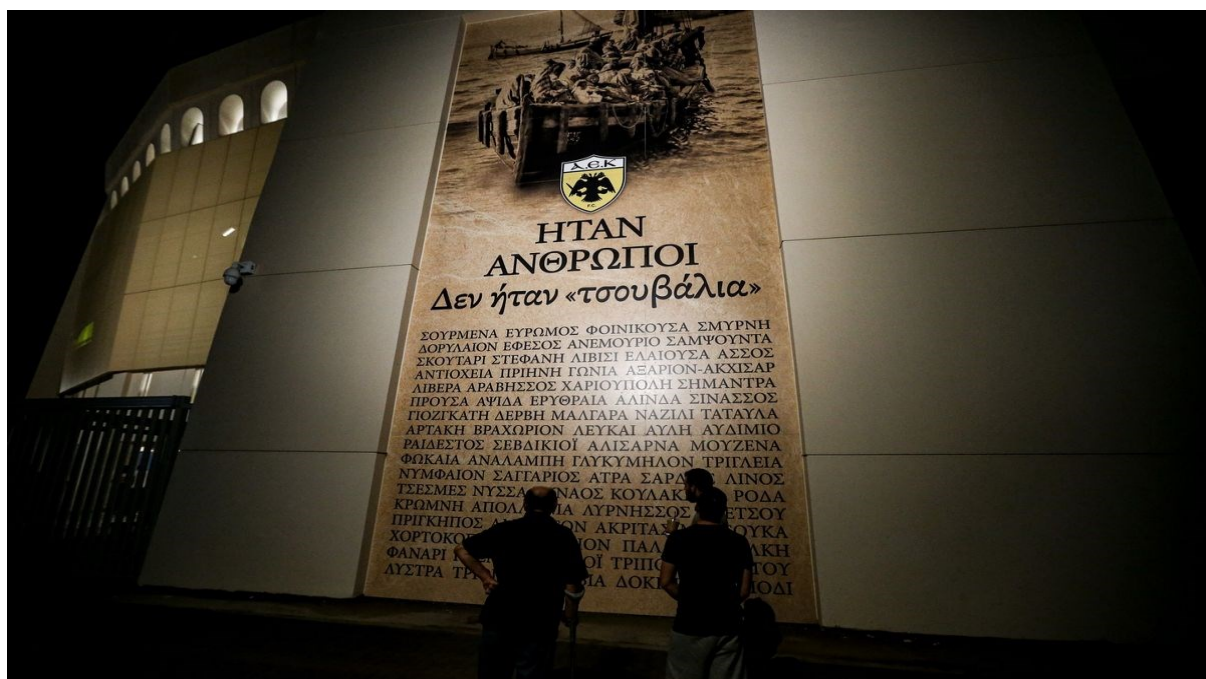
Εικόνα 14: ΗΤΑΝ ΑΝΘΡΩΠΟΙ Δεν ήταν τσουβάλια. Επιγραφή στο νέο γήπεδο της Α.Ε.Κ. 16