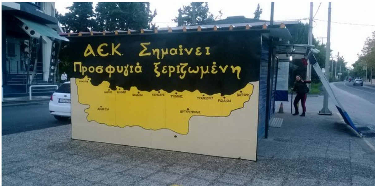
Εικόνα 5: ΑΕΚ σημαίνει Προσφυγιά ξεριζωμένη. Τοιχογραφία στην περιοχή του νέου γηπέδου της Α.Ε.Κ. στην Νέα Φιλαδέλφεια. 7