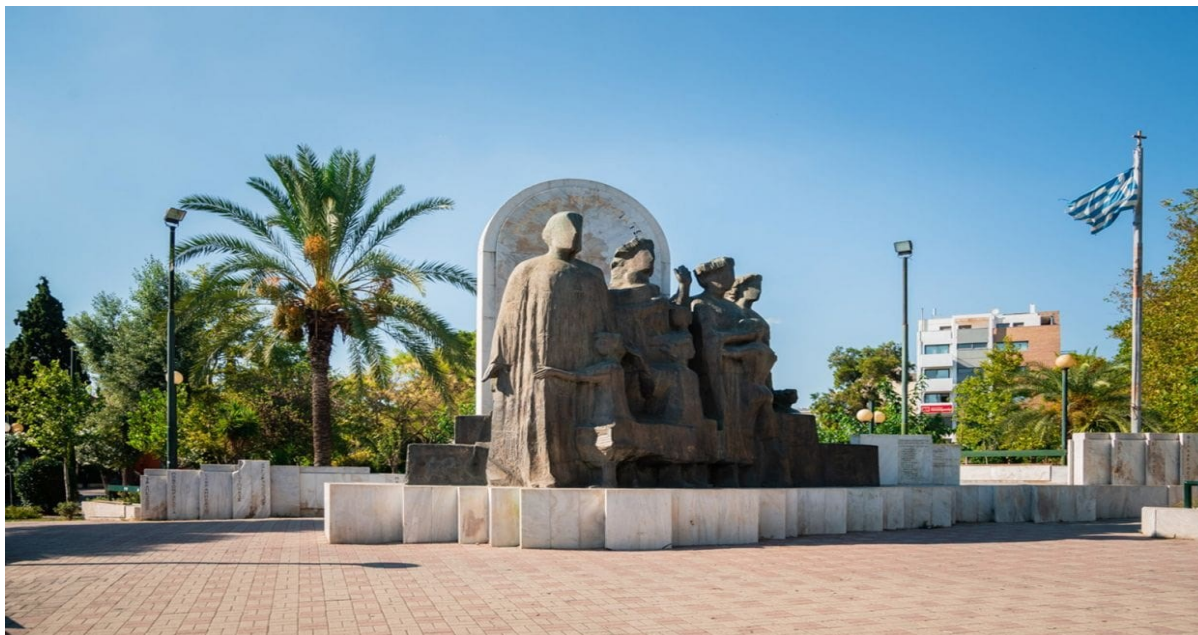
Εικόνα 2: Το «Πάρκο Μνημείον Μικρασιατών και Αλησμόνητων Πατρίδων», αποτέλεσε έργο του Αρχιτέκτονα Κώστα Π. Χριστόπουλου, βρίσκεται στη συμβολή της Λεωφόρου Δεκελείας με την οδό Αδελφών Γεωργιάδη, στην περιοχή της Νέας Φιλαδέλφειας 2