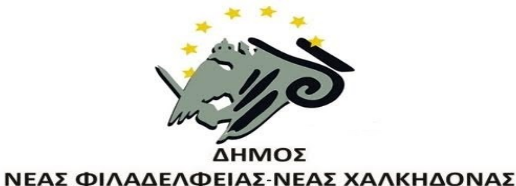
Εικόνα 3: Λογότυπο Δήμου Νέας Φιλαδέλφειας- Νέας Χαλκηδόνας. Αποτελέσε αρχικά, το δηλωτικό σήμα του Δήμου Χαλκηδόνας αλλά και μετά το καλλικρατικό πρόγραμμα, του ενιαίου δήμου. Διακρίνεται από το κιονόκρανο Μικρασιατικού Ιωνικού ρυθμού και από το αριστερό μέρος του δικέφαλου αετού, επιβεβαιώνοντας την ταύτιση με την πολιτιστική ιστορία της πόλης και την σύνδεση με τον σύλλογο της Α.Ε.Κ. 3