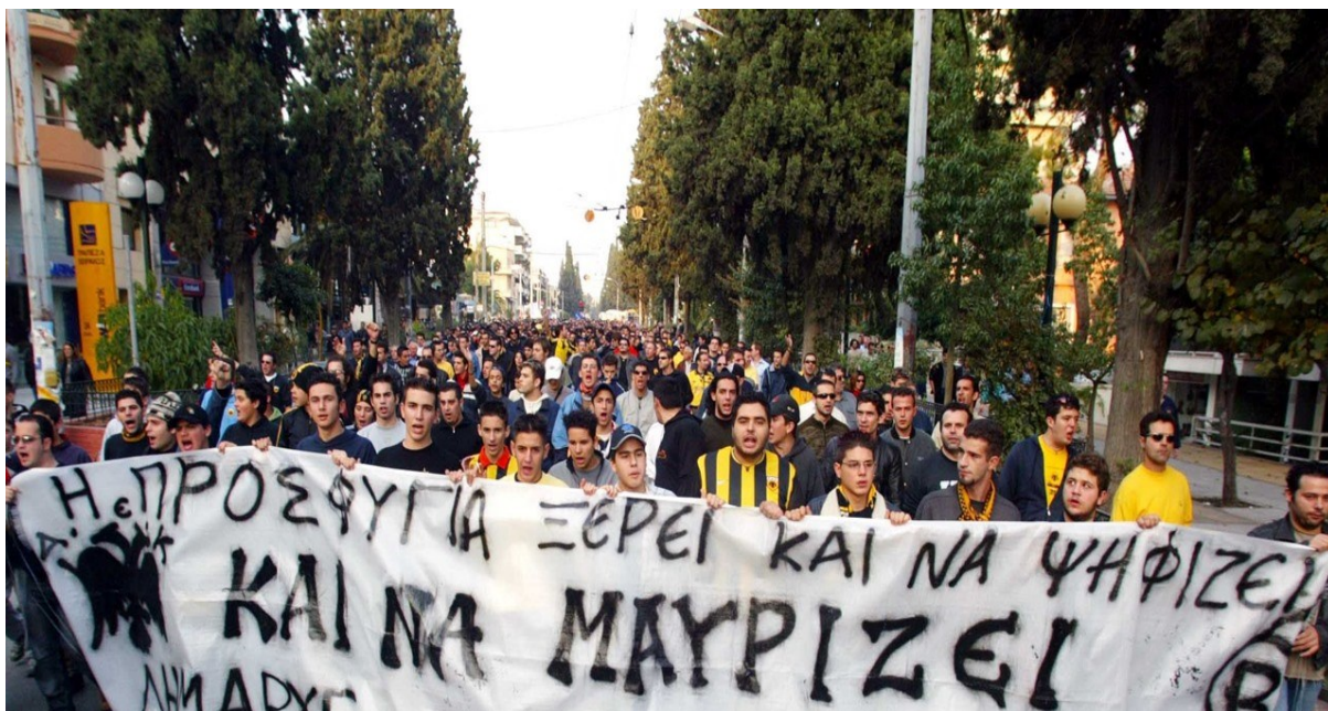
Εικόνα 7: Πορεία διαμαρτυρίας οργανωμένων οπαδών ΑΕΚ κατά του Δήμου Νέας Φιλαδέλφειας 9