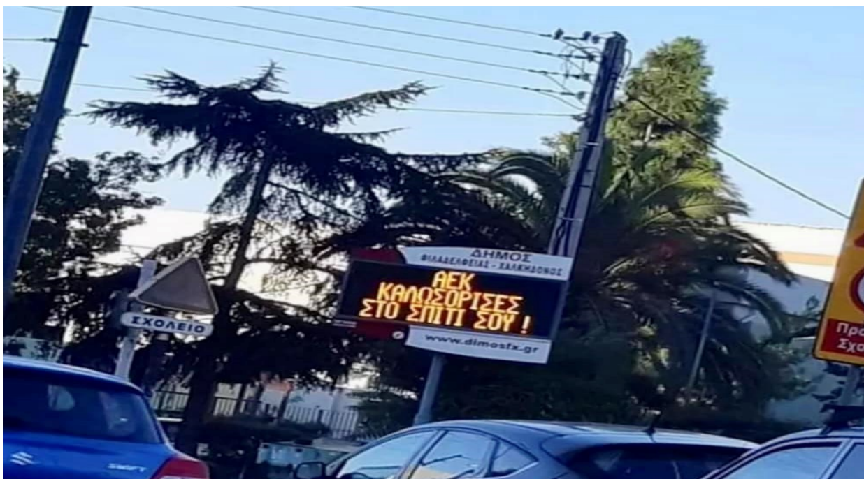
Εικόνα 11: ΑΕΚ Καλωσόρισε στο σπίτι σου. Μήνυμα καλωσορίσματος σε ηλεκτρικό πίνακα του Δήμου Νέας Φιλαδέλφειας- Νέας Χαλκηδόνας 13