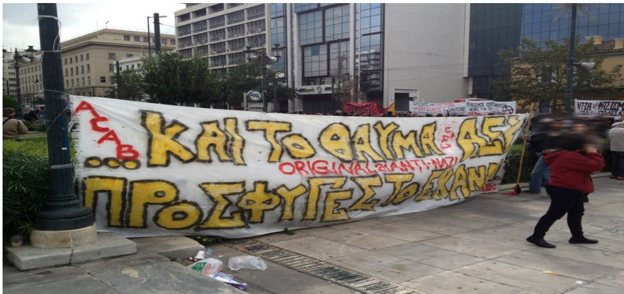
Εικόνα 9: Και το θαύμα της Α.Ε.Κ. πρόσφυγες το έκαναν. Πανό της Original21 στο δημαρχείο της Νέας Φιλαδέλφειας, κατά την διάρκεια των κινητοποιήσεων 11

Ο σύλλογος της Α.Ε.Κ. επιστρέφει στην πόλη της, την Νέα Φιλαδέλφεια, εκεί που οι πρόγονοι, διωγμένοι από τα σπίτια και την γη τους, την δημιούργησαν. Η έντονη συναισθηματική διέγερση και η προσμονή του επόμενου αθλητικού συμβάντος στην περιοχή της Νέας Φιλαδέλφειας, αποτελεί πλέον συστηματικό μοτίβο της κοινωνικής μνήμης των οπαδών της Α.Ε.Κ. Ο οπαδικός κόσμος του συλλόγου συνδέεται με ένα έντονο αίσθημα τοποφιλίας που καλλιεργείται γύρω από την φυσική έδρα της ομάδας, την Νέα Φιλαδέλφεια, αποτελώντας έτσι ισχυρό παράγοντα ταυτοποίησης με την ομάδα (Σπύρος, 2013). Το γήπεδο αποτελεί μια ιδιαίτερα συμβολική κρυστάλλωση της τοπικότητας και αποτυπώνει μια αίσθηση του «εμείς» και του «ανήκειν». Έτσι μια πόλη, στην περίπτωση που εξετάζουμε η περιοχή της Νέας Φιλαδέλφειας, ταυτίζεται με τον χώρο μέσω της σύνδεσης με την ομάδα και συγκεκριμένα του αθλητικού σωματείου της Α.Ε.Κ. (Κυπριανός & Χουμεριανός, 2009, σσ.217).