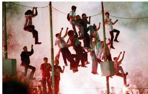
Εικόνα 2: Ultras