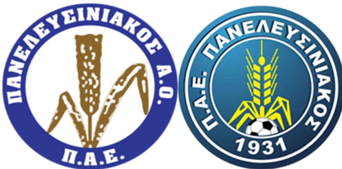
Εικόνα 6.: Το παλιό λογότυπο της Π.Α.Ε. και το λογότυπο της Π.Α.Ε. από το 2015 έως το 2017.

https://el.wikipedia.org/wiki/Panopticon