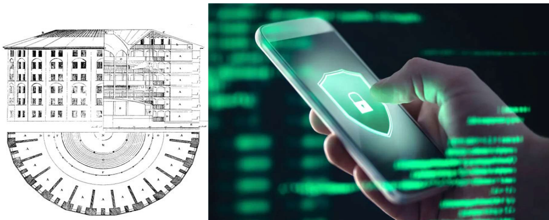
Εικόνα 5.: «Το Πανοπτικόν» και η σύγχρονη μέθοδος παρακολούθησης μέσω κινητού.

https://el.wikipedia.org/wiki/Panopticon