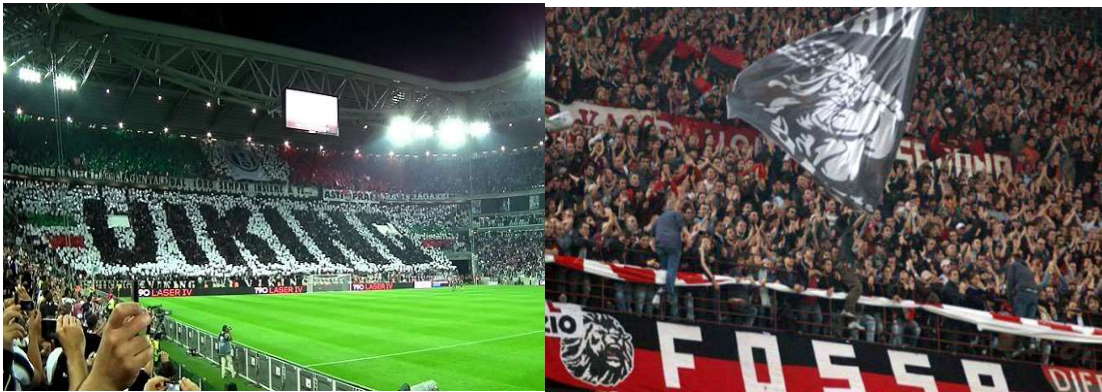
Εικόνα 1.: Οι δύο σημαίες που γέννησαν μια μεγάλη οπαδική κόντρα στην Ιταλία και έκλεισαν έναν ιστορικό σύνδεσμο,

http://www.forzajuve.gr/2015/07/viking-fossa-dei-leoni.html