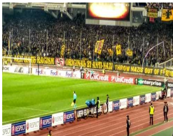
Εικόνα 3.: ΤΟΦΑ (Τρομοκρατική Οργάνωση Φιλάθλων ΑΕΚ), Ακροδεξιά και εξέδρα, η περίπτωση της ΑΕΚ.

https://www.vice.com/el/article/59k53x/akrode3ia-kai-e3edra-h-periptwsh-ths-ack