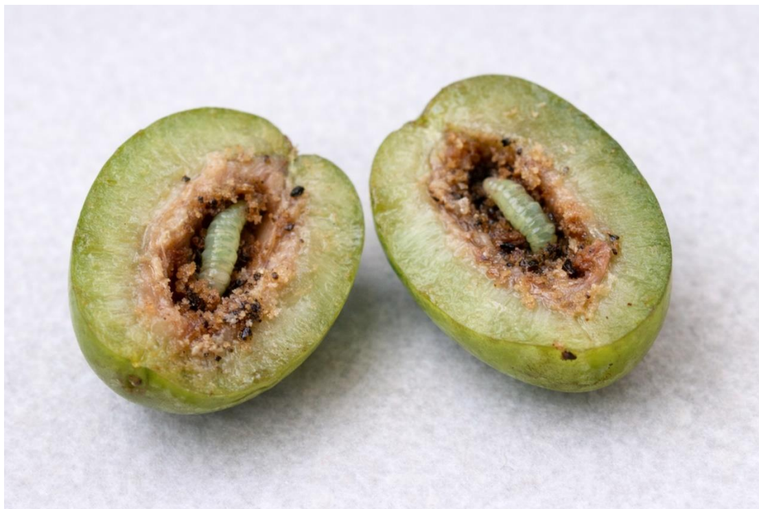
Εικόνα 7. Προσβεβλημένοι καρποί από πυρηνοτρύτη.

επιβίωση του εντόμου, ενώ ήπιοι χειμώνες ευνοούν την ανάπτυξή του (Ζαρταλούδης, 2006).