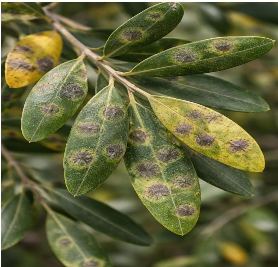
Εικόνα 10. Χαρακτηριστικό σύμπτωμα κυκλοκόνιου.

(Η εικόνα δημιουργήθηκε με χρήση εργαλείου τεχνητής νοημοσύνης (AI))