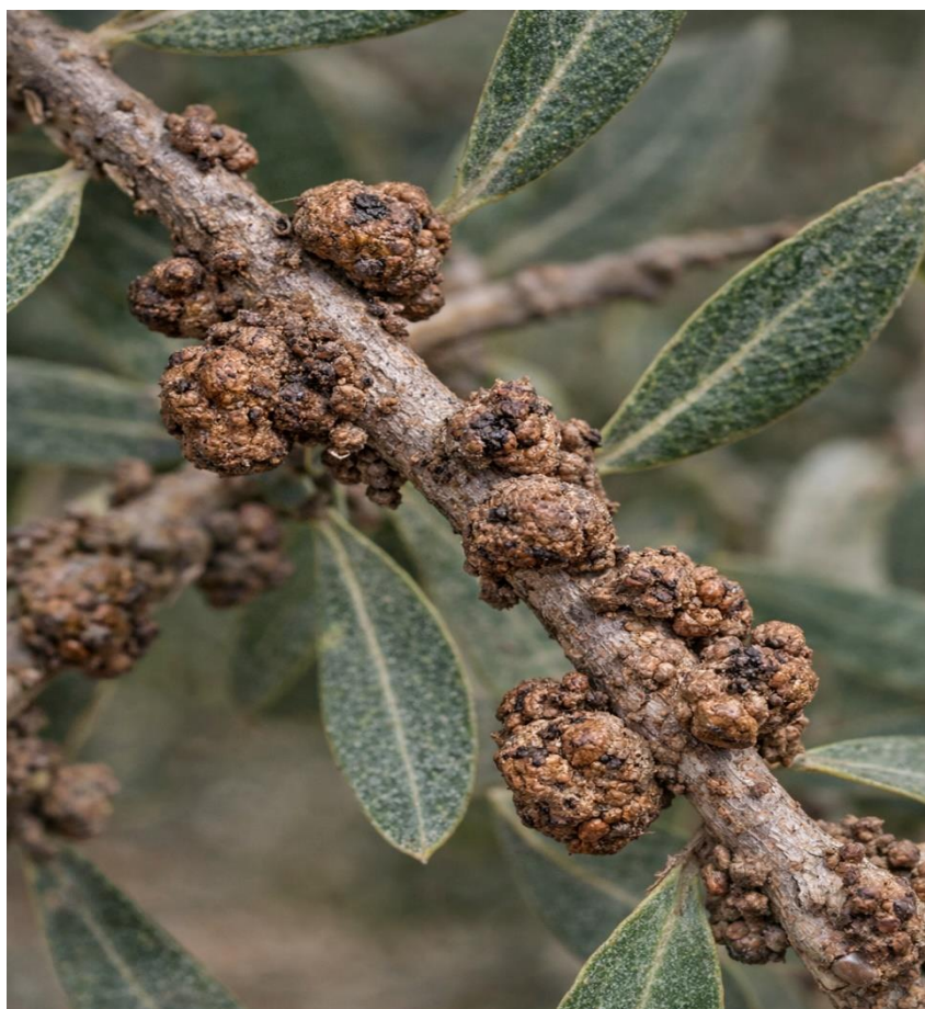
Εικόνα 12. Φυματίωση της ελιάς.

Η προσβολή περιορίζεται στα εξωτερικά στρώματα του καρπού και μειώνει την ποιότητά του, ειδικά στις ποικιλίες που προορίζονται για κονσερβοποίηση.