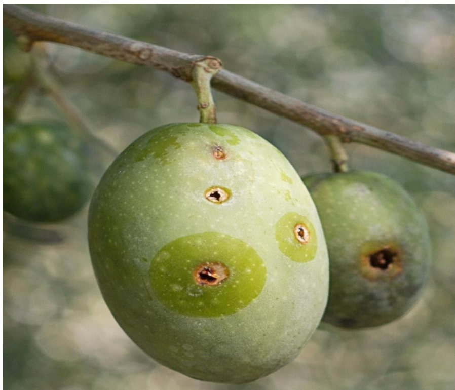
Εικόνα 2. Προσβολή του δάκου σε καρπό ελιάς.

(Η εικόνα δημιουργήθηκε με χρήση εργαλείου τεχνητής νοημοσύνης (AI))