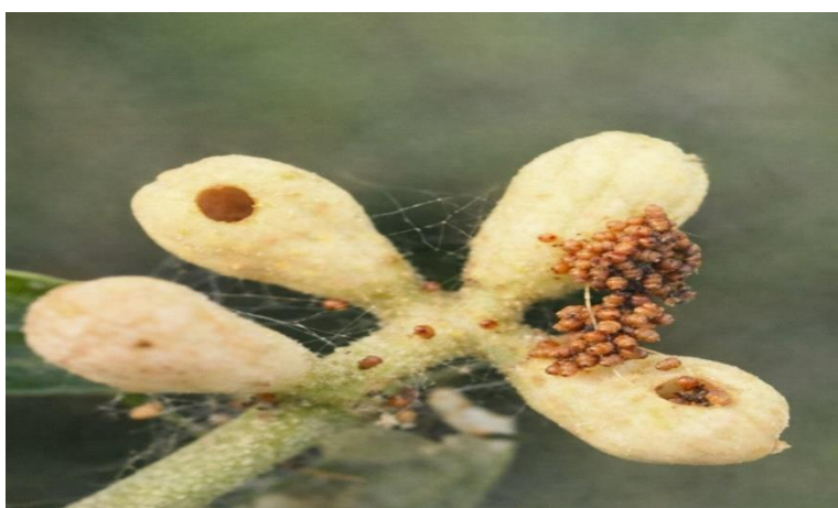
Εικόνα 6. Προσβεβλημένο άνθος ελιάς.

(Η εικόνα δημιουργήθηκε με χρήση εργαλείου τεχνητής νοημοσύνης (AI))