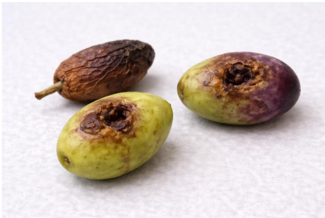
Εικόνα 9. Προσβεβλημένες ελιές από γλοιοσπόριο.

βυθίζονται, παρουσιάζουν έντονες ρυτιδώσεις και σε συνθήκες υψηλής υγρασίας καλύπτονται από μαύρα στίγματα, που αντιστοιχούν στις καρποφορίες του μύκητα, όπως χαρακτηριστικά φαίνεται στην Εικόνα 9. Οι ώριμοι καρποί είτε πέφτουν στο έδαφος και αποσυντίθενται είτε παραμένουν στο δέντρο, συρρικνώνονται και μετατρέπονται σε «μούμιες» (Ζαρταλούδης, 2006). Στα φύλλα εμφανίζονται καστανόχρωμες ή χλωρωτικές κηλίδες, που με υγρό καιρό καλύπτονται από ρόδινες μάζες σπορίων.