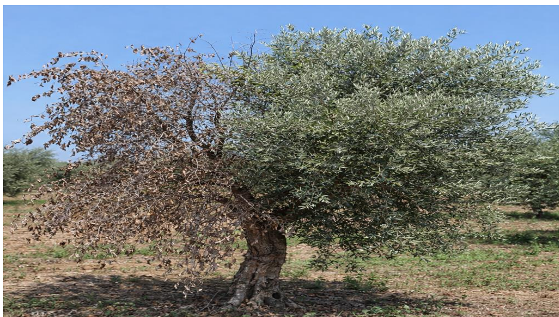
Εικόνα 11. Ημιπληγία ελιάς.

(Η εικόνα δημιουργήθηκε με χρήση εργαλείου τεχνητής νοημοσύνης (AI))