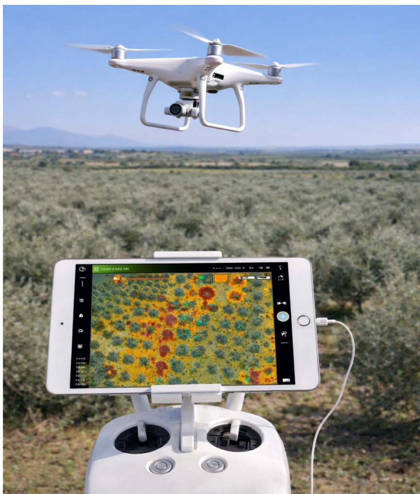
Εικόνα 14: Χαρτογράφηση ελαιώνα μεσω UAV

Η διασύνδεση UAVs με πλατφόρμες υποστήριξης αποφάσεων (DSS), μετεωρολογικά μοντέλα, συστήματα IoT και 5G, επιτρέπει πλέον την πραγματική αυτοματοποίηση στη γεωργία, με άμεση ροή δεδομένων από το πεδίο προς τους παραγωγούς. Η τεχνολογία αυτή προσφέρει τεράστιες δυνατότητες στη βελτιστοποίηση των επεμβάσεων και στην ελαχιστοποίηση των απωλειών, αποτελώντας θεμέλιο λίθο για τη γεωργία του μέλλοντος.