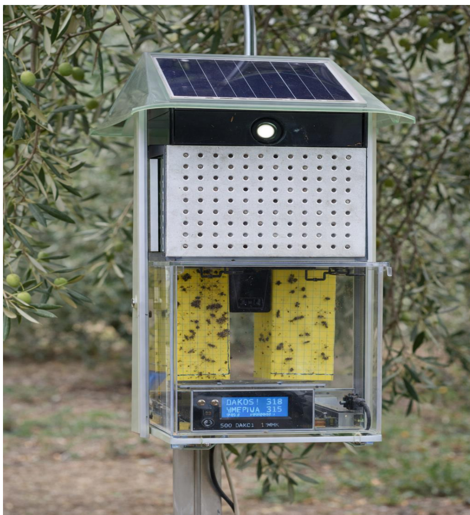
Εικόνα 13: Έξυπνη ηλεκτρονική παγίδα.

Η παγίδα είναι ενεργειακά αυτόνομη (με χρήση ηλιακής ενέργειας) και μπορεί να μεταδίδει ασύρματα τα δεδομένα σε κεντρική βάση ή σε Συστήματα Υποστήριξης Αποφάσεων (DSS), καθιστώντας εφικτή την πραγματική παρακολούθηση σε απομακρυσμένους ελαιώνες. Έτσι, οι γεωπόνοι και παραγωγοί μπορούν να λαμβάνουν αποφάσεις για στοχευμένες επεμβάσεις με ακριβή χρονισμό, μειώνοντας τη χρήση φυτοφαρμάκων και εξασφαλίζοντας καλύτερη προστασία των καλλιεργειών. Το σύστημα αυτό αποτελεί παράδειγμα ενσωμάτωσης της γεωργίας ακριβείας στη βιοπαρακολούθηση επιβλαβών οργανισμών, παρέχοντας ποσοτικά δεδομένα που μπορούν να αξιοποιηθούν και σε ευρύτερες μοντελοποιήσεις πληθυσμιακής δυναμικής.