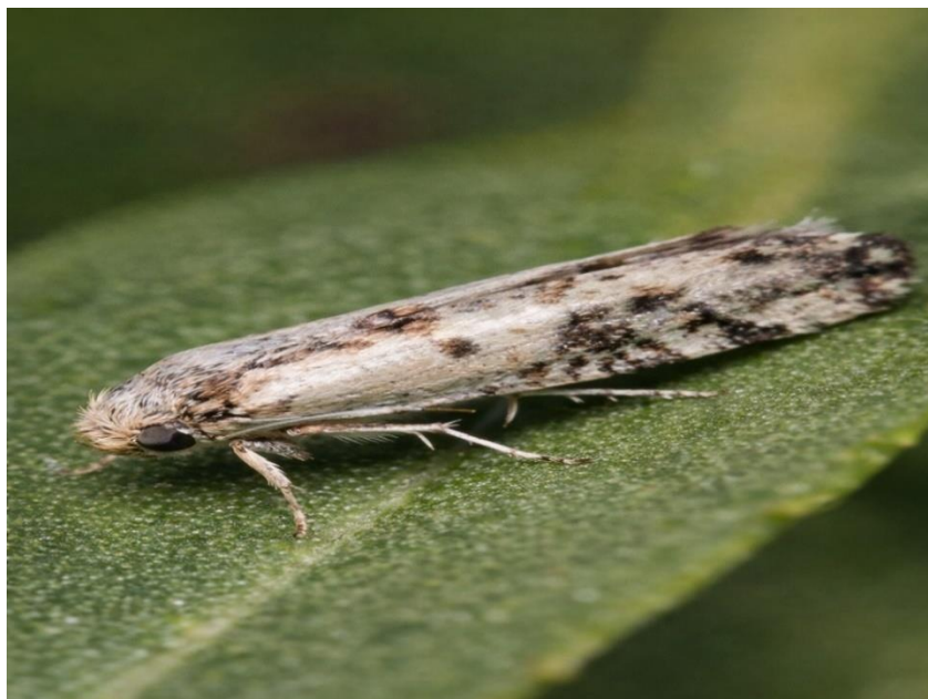
Εικόνα 4. Ενήλικο του πυρηνοτρύτη της ελιάς.

Τα ενήλικα έχουν μήκος 6-6,5 mm και άνοιγμα πτερύγων 13-15 mm. Ο χρωματισμός τους κυμαίνεται από τεφρά έως ανοιχτοκάστανά, με μεταλλικές ανταύγειες στις πτέρυγες, όπως φαίνεται και στην Εικόνα 4. Τα αυγά είναι μικρά, σχεδόν κυκλικά (0,5 x 0,4 mm) και έχουν ανοιχτοκίτρινο χρώμα. Οι προνύμφες είναι πρασινωπές ή καστανόπράσινες και φτάνουν τα 7-8,5 mm. Η νύμφη έχει καστανό χρώμα με μήκος 5-6 mm και βρίσκεται μέσα σε αραιό βομβύκιο πάνω στο δέντρο ή στο έδαφος (Ναβροζίδης & Ανδρεάδης, 2012).