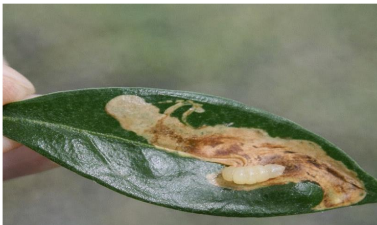
Εικόνα 5. Προσβεβλημένο φύλλο ελιάς από πυρηνοτρύτη.

(Η εικόνα δημιουργήθηκε με χρήση εργαλείου τεχνητής νοημοσύνης (AI))