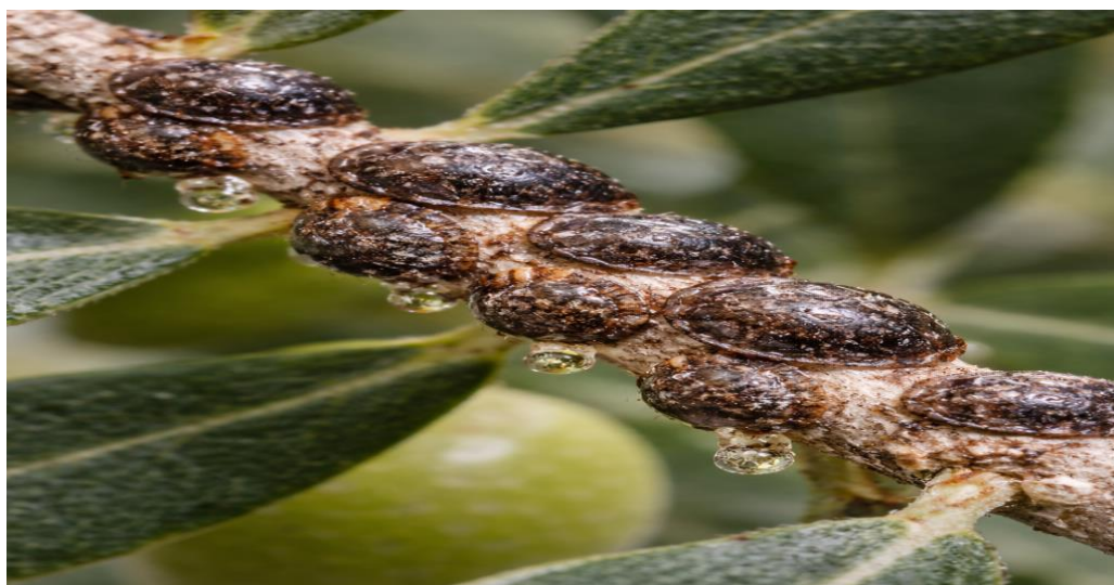
Εικόνα 8. Λεκάριο της ελιάς.

(Η εικόνα δημιουργήθηκε με χρήση εργαλείου τεχνητής νοημοσύνης (AI))