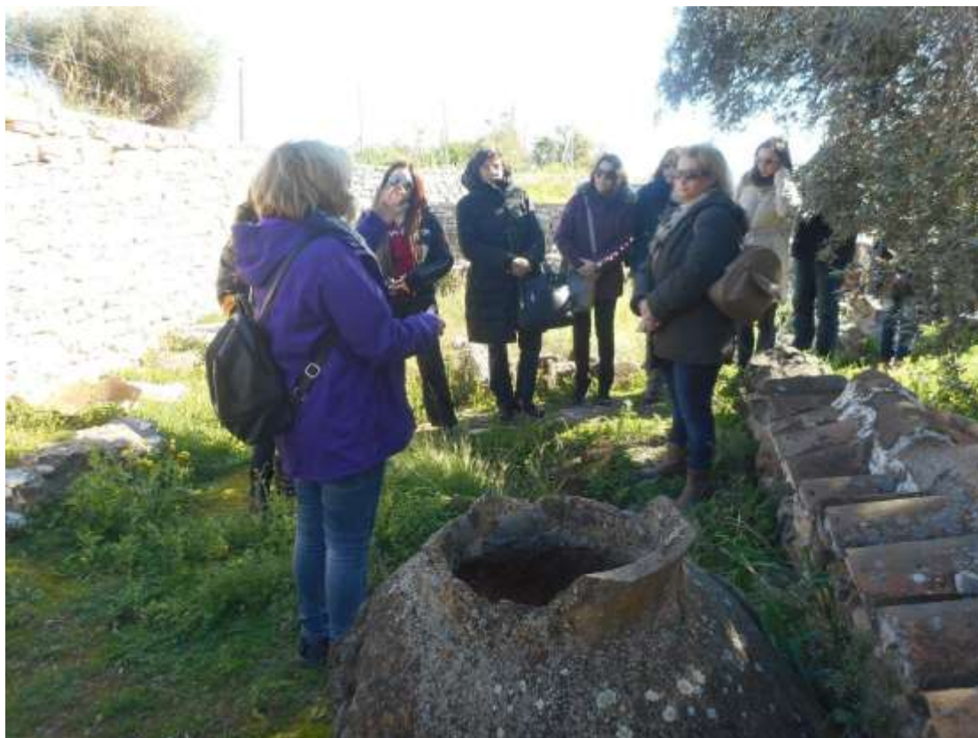
Εικόνα 3: Ανακαλύπτοντας τους «θησαυρούς» στη Λέρνη