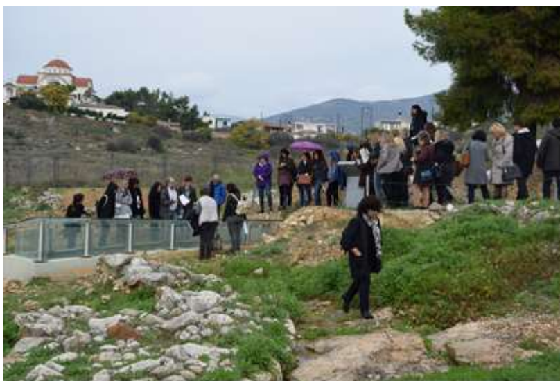
Εικόνα 5: Περιδιαβαίνοντας τις Αρχαιότητες στη Μιδέα