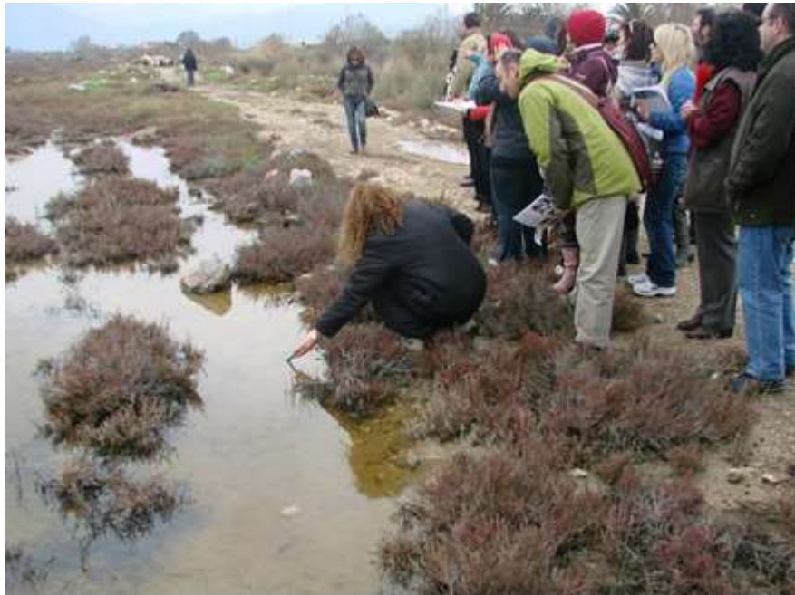
Εικόνα 4: Μετρήσεις στο πεδίο του υγρότοπου