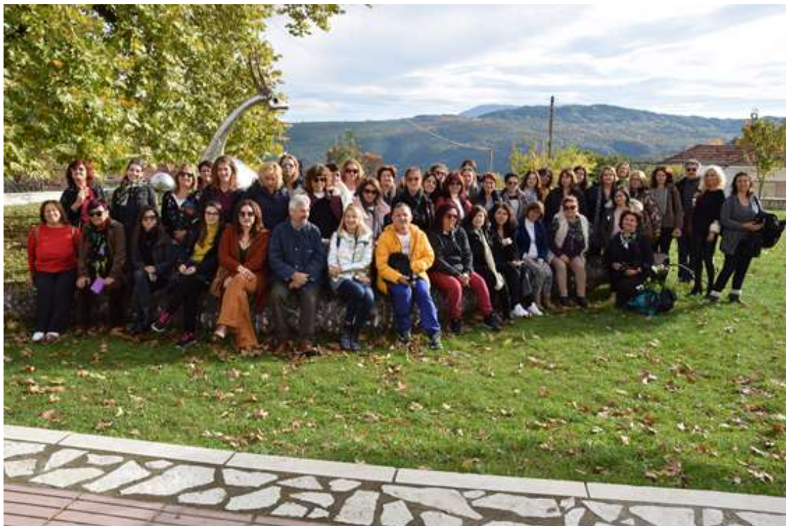
Εικόνα 7: Η τελευταία βιωματική δράση του ΚΠΕ πριν την πανδημία. Επίσκεψη στο μουσείο Παπαγιάννη (Νοέμβρης 2019)