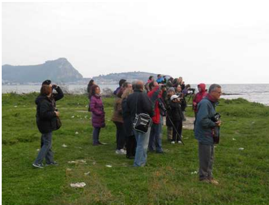
Εικόνα 2: Οрниθοπαράτηρηση στον Υγρότοπο