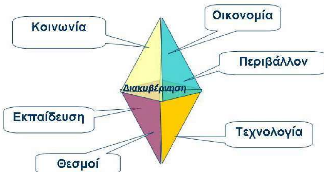
Εικόνα 1: Η διπλή τριγωνική πυραμίδα, «αδάμας», της Αειφόρου Ανάπτυξης (Σκούλλος, 2007)

τρία αυτά συστήματα, αλληλοεπηρεάζονται, ενώ η Αειφορία επιτυγχάνεται από τη δική τους καλή λειτουργία (Φλογαΐτη, 2006). Κατά τον Σκούλλο (2007), το σχήμα της ΑΑ, αποτελούμενο από τους τρεις πυλώνες, οικονομία, περιβάλλον και κοινωνία, μετασχηματίζεται σε ένα τετράεδρο, όπου στη βάση τοποθετείται η διακυβέρνηση, στοιχεία της οποίας είναι η εκπαίδευση μαζί με την τεχνολογία και τους θεσμούς. Έτσι προκύπτει ένας «αδάμας», μια διπλή τριγωνική πυραμίδα, αυτή της ΑΑ. Η αναπαράσταση αυτή βοηθά στην κατανόηση του ακριβούς περιεχομένου της Εκπαίδευσης για την Αειφόρο Ανάπτυξη (ΕΑΑ), όπου εντάσσεται και η διακυβέρνηση, δηλαδή ο πολιτισμός. Η έννοια της Αειφορίας επομένως, προκύπτει ως εξέλιξη της έννοιας του περιβάλλοντος και εμφανίζεται τη δεκαετία του '80, δίνοντας στην ΠΕ νέα δυναμική, καθώς ενσωματώνει μαζί με το περιβάλλον, την κοινωνία, την οικονομία και την πολιτική (Φλογαΐτη, 2011).