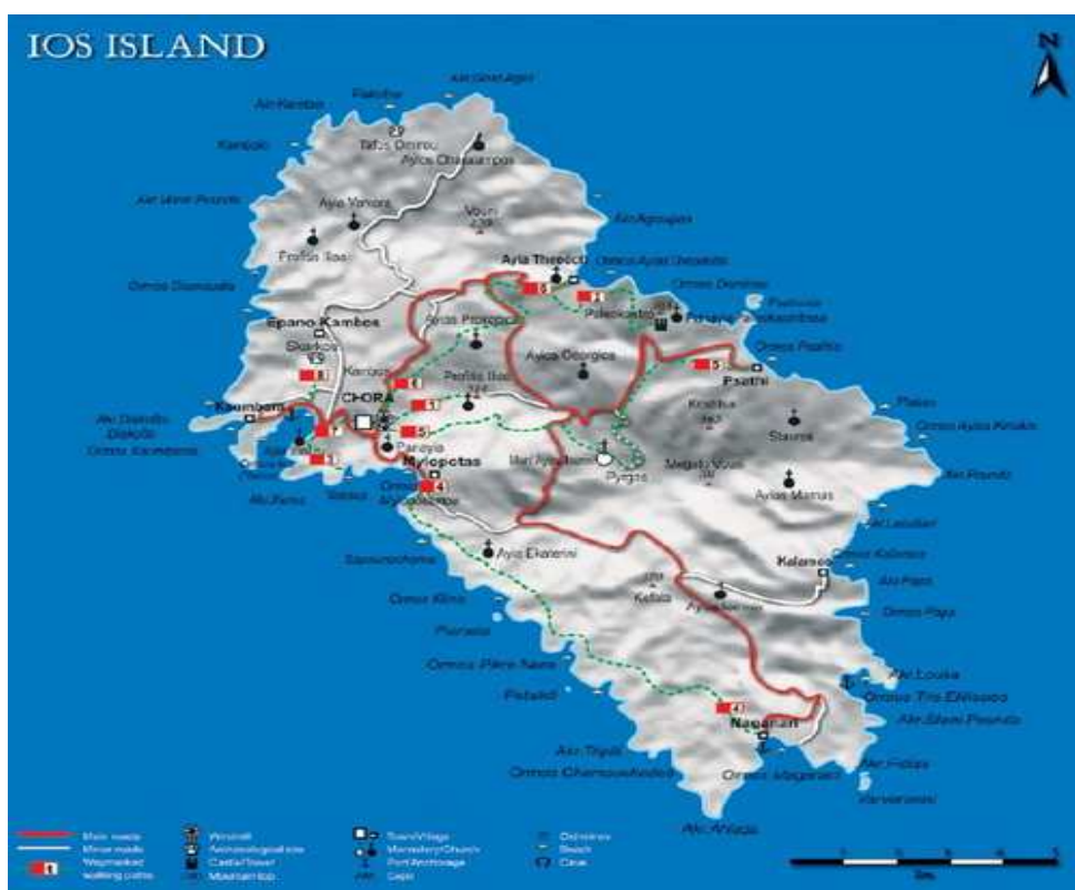
Εικόνα 3: Χάρτης Ίου

ημιορεινό νησί, όπου ανάμεσα στα βουνά απλώνονται πεδινές εκτάσεις που φιλοξενούν καλλιέργειες ανθεκτικών δέντρων, όπως ελιές και αμπέλια, τα οποία δεν απαιτούν μεγάλη ποσότητα νερού. Η Χώρα του νησιού, χτισμένη στην κορυφή ενός λόφου, ξεχωρίζει για τα χαμηλά, λευκά σπίτια της. Το νησί είναι ιδιαίτερα φημισμένο για τις απέραντες χρυσές αμμουδιές του, τα καθαρά, γαλαζοπράσινα νερά και τους γραφικούς μικρούς όρμους. Σημαντικό στοιχείο της μορφολογίας του νησιού είναι η εκτεταμένη ακτογραμμή των 86 χιλιομέτρων, εκ των οποίων τα 32 χιλιόμετρα αποτελούνται από παραλίες με άμμο.