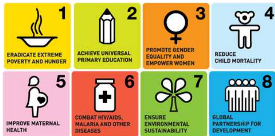
Εικόνα 1: : Στόχοι ανάπτυξης Χιλιετίας Ηνωμένων Εθνών

Χιλιετίας (Millennium Development Goals – MDGs), αποτέλεσαν ένα από τα πλέον φιλόδοξα αναπτυξιακά εγχειρήματα με παγκόσμια αποδοχή. Στο σύνολό τους περιλάμβαναν οκτώ βασικούς άξονες, από την εξάλειψη της ακραίας φτώχειας (Στόχος 1) έως την προώθηση της παγκόσμιας συνεργασίας για την ανάπτυξη (Στόχος 8). Οι MDGs περιελάμβαναν ένα ολοκληρωμένο πλαίσιο δράσεων που στοχεύουν στην ενδυνάμωση και υποστήριξη των πλέον ευάλωτων και περιθωριοποιημένων πληθυσμών διεθνώς.