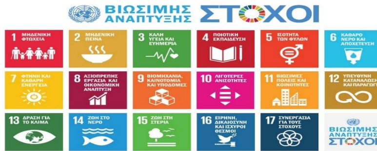
Εικόνα 2: :Οι 17 Στόχοι Βιώσιμης Ανάπτυξης (Ηνωμένα Έθνη, 2023)