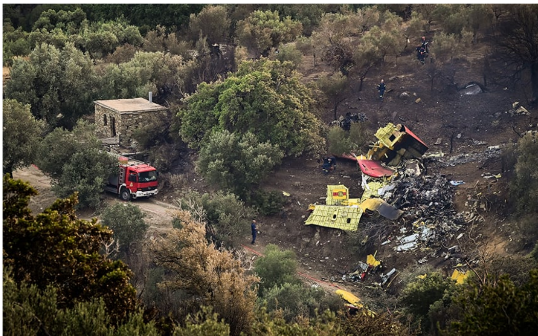
Εικόνα 18 Τα συντρίμια του CL-215

Αναζητούνται τα ακριβή αίτια της πτώσης του πυροσβεστικού αεροπλάνου