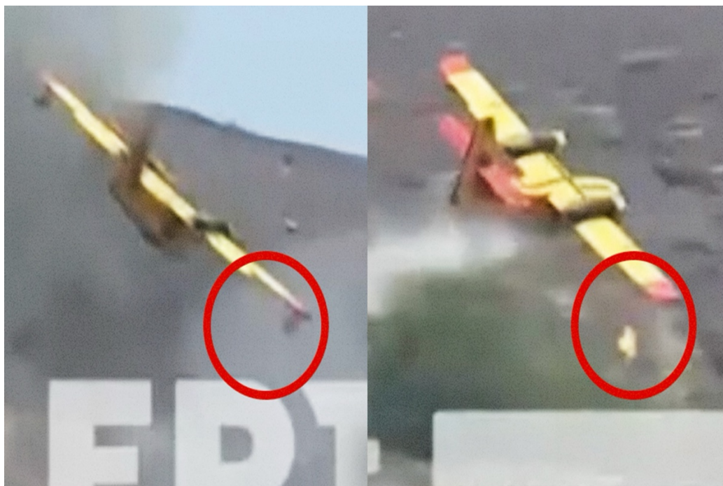
Εικόνα 22 Στιγμιότυπο από το βίντεο της EPT 14 από τη πτώση του Canadair

Σε πλήρη εξέλιξη βρίσκεται η επιχείρηση έρευνας και διάσωσης.