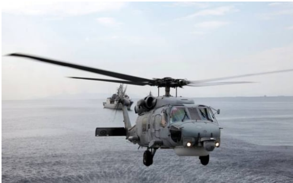
Εικόνα 1 Ελικόπτερο του Πολεμικού Ναυτικού

Μετά την τραγωδία, η έρευνα. Άγνωστα ωστόσο παραμένουν τα αίτια της συντριβής του Agusta Bell, που βρισκόταν σε προγραμματισμένη νυχτερινή άσκηση κατά την οποία προσέκρουσε σε βράχο ύψους 200 μέτρων στη νήσο Κίναρο.