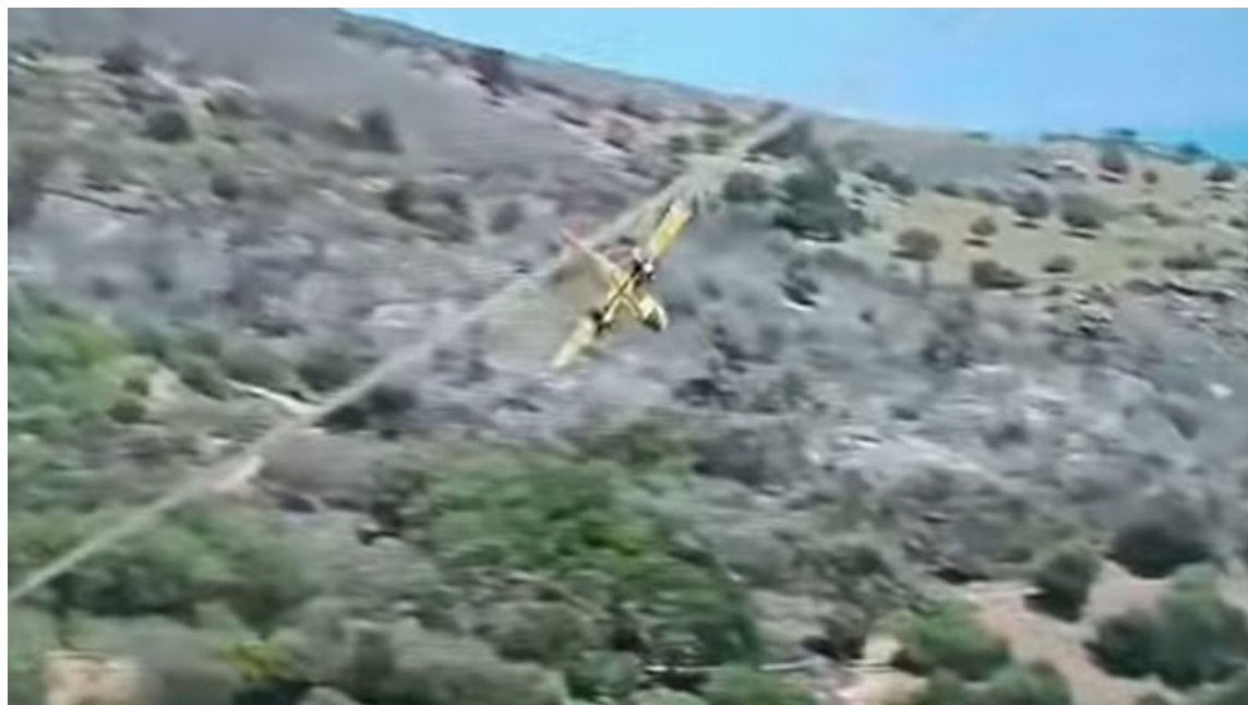
Εικόνα 21 Το CL-215 λίγο πριν τη πτώση

«Σε εξέλιξη βρίσκεται επιχείρηση έρευνας - διάσωσης για τους δύο Ιπταμένους»