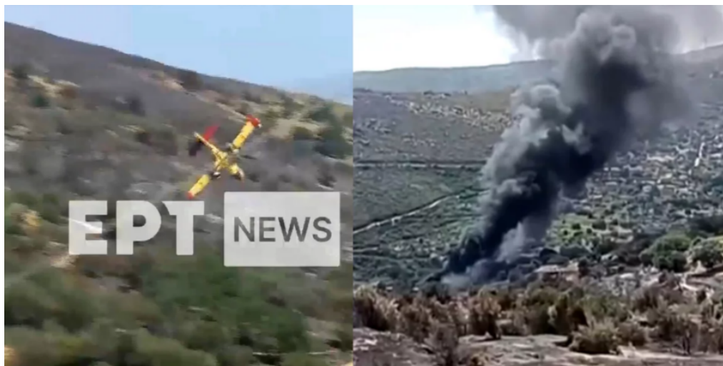
Εικόνα 17 Το CL-215 πριν και μετά τη πτώση

Ένα τραγικό περιστατικό σημειώθηκε λίγο πριν τις 3 το μεσημέρι της Τρίτης στην Κάρυστο της Νότιας Εύβοιας.