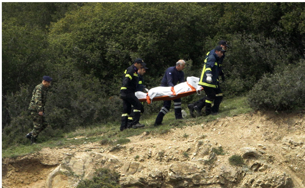
Εικόνα 12 Η ανάσυρση των νεκρών από το μοιραίο Ε/Π ΕΣ 625