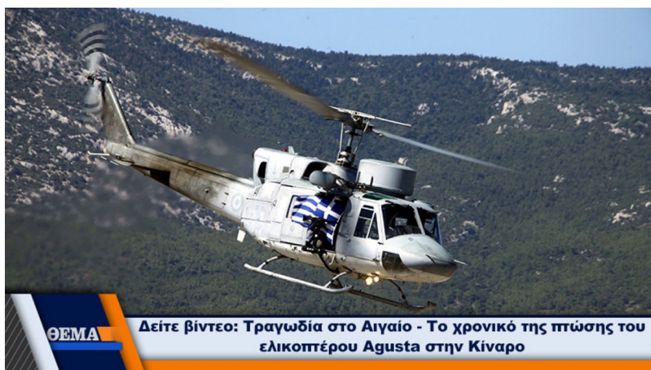
Εικόνα 2 Φωτογραφία από το Θέμα αντίστοιχου ελικοπτέρου του ΠΝ

Το AB-212 προσέκρουσε σε λόφο της νησίδας, η ουρά αποκολλήθηκε και τα υπόλοιπα τμήματα του ελικοπτέρου έπεσαν στη θάλασσα - Οι σοροί εντοπίστηκαν σε μεγάλη απόσταση, ενδεικτικό της σφοδρότητας της σύγκρουσης.