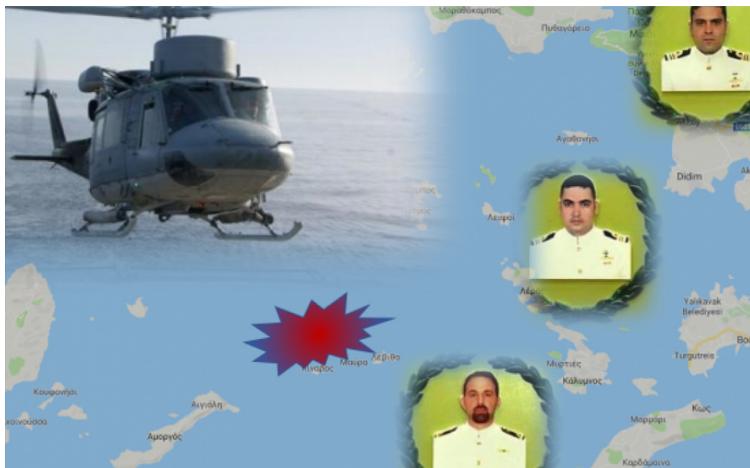
Εικόνα 6