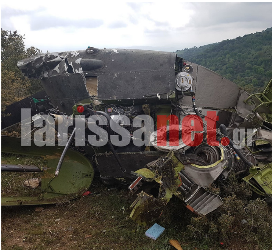
Εικόνα 9 Τα συντρίμια του μοιραίου Ε/Π ΕΣ 625

σημαίνει ότι το ελικόπτερο καρφώθηκε στο έδαφος με το εμπρόσθιο τμήμα είτε συνετρίβη πέφτοντας στη γη με το αριστερό σκέλος. Η αρχιλοχίας έχει κατάγμα λεκάνης και τραύμα στον αυχένα. Βρίσκεται εκτός κινδύνου και σύμφωνα με πληροφορίες οι αξονικές τομογραφίες στις οποίες υπεβλήθη ήταν καθαρές.