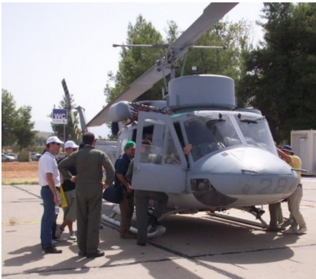
Εικόνα 4 Παλαιότερη φωτογραφία του μοιραίου ελικοπτέρου