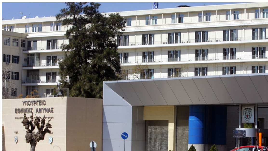
Εικόνα 16 Το Υπουργείο Εθνικής Άμυνας

Στη δημοσιότητα έδωσε το ΓΕΕΘΑ τα ονόματα των στρατιωτικών που έχασαν τη ζωή τους στο στρατιωτικό ελικόπτερο 9 που έπεσε στο Σαραντάπορο. Σύμφωνα με την ανακοίνωση του ΓΕΕΘΑ: «Την Τετάρτη 19 Απριλίου 2017 πρωινές ώρες, ελικόπτερο του ΣΞ τ. UH-1H, με πέντε επιβαίνοντες, το οποίο εκτελούσε προγραμματισμένη πτήση από τη Λάρισα στην Κοζάνη, κατέπεσε στην περιοχή Σαρανταπόρου Ελασσόνας. Αναλήφθηκε άμεσα επιχείρηση έρευνας-διάσωσης, υπό τον συντονισμό του ΕΘΚΕΠΙΧ/ΓΕΕΘΑ με παρουσία της Πολιτικής και Στρατιωτικής ηγεσίας. Από την επιτόπια έρευνα εντοπίστηκαν τέσσερις σοροί επιβαινόντων, οι οποίες και ταυτοποιήθηκαν ως του Υποστρατήγου Ιωάννη Τζανιδάκη, του Συνταγματάρχη (ΤΘ) Θωμά Αδάμου, του Ταγματάρχη (ΑΣ) Δημοσθένη Γούλα και του Υπολοχαγού (ΑΣ) Κωνσταντίνου Χατζή. Επίσης εντοπίστηκε τραυματισμένη εκτός κινδύνου η Αρχιλοχίας (ΑΣ) Βασιλική Πλεξίδα η οποία και διακομίζεται στο 424 ΓΣΝΣ Θεσσαλονίκης. Ο Αρχηγός ΓΕΣ Αντιστράτηγος Αλκιβιάδης Στεφανής μεταβαίνει στην περιοχή του ατυχήματος. Η επιτροπή διερεύνησης έχει ήδη αναλάβει έργο στην περιοχή ατυχήματος».