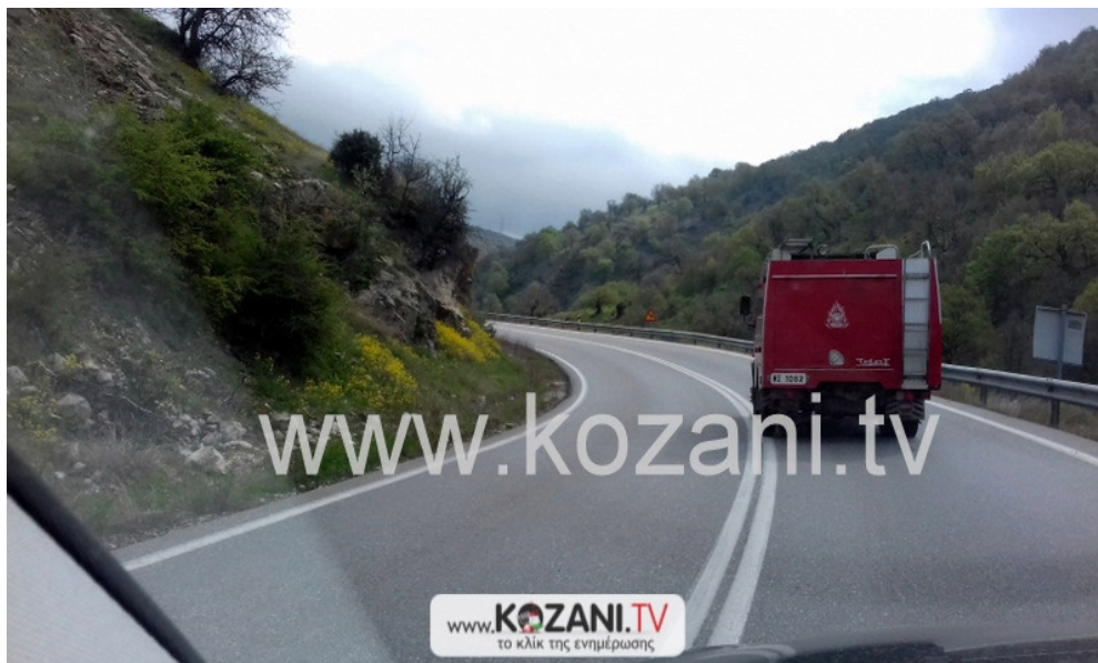
Εικόνα 15 Τα πυροσβεστικά μέσα σε κίνηση για το σημείο της πρόσκρουσης του Ε/Π