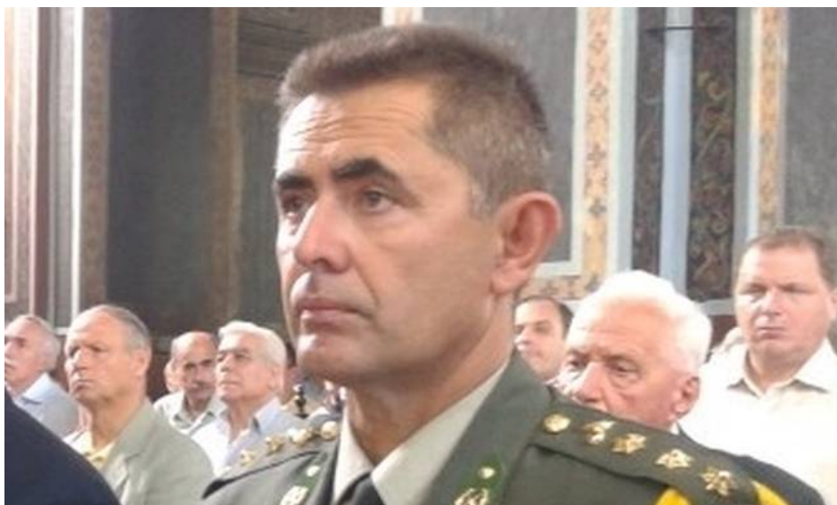
Εικόνα 8 Ο Συνταγματάρχης Θωμάς Αδάμου

Νεκροί είναι ο υποδιοικητής της 1ης Στρατιάς υποστράτηγος Ιωάννης Τζανιδάκης, ο συνταγματάρχης Θωμάς Αδάμου, ο ταγματάρχης (χειριστής του ελικοπτέρου) Δημοσθένης Γούλας και ο υπολοχαγός (συγκυβερνήτης) Κωνσταντίνος Χατζής. Εκτός κινδύνου είναι η αρχιλοχίας Βασιλική Πλεξίδα η οποία ανασύρθηκε ζωντανή από τα συντρίμια του στρατιωτικού ελικοπτέρου και μεταφέρθηκε στο 424 Γενικό Στρατιωτικό Νοσοκομείο.