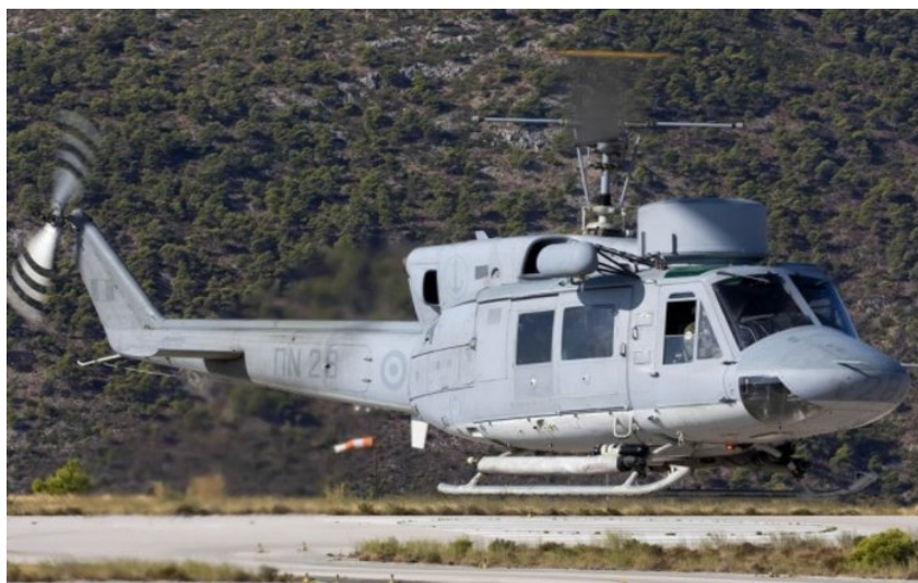
Εικόνα 3 Ελικόπτερο του ΠΝ τύπου Agusta Bell 212

Σε βάθος 50 έως 100 μέτρων στη θάλασσα και την ξηρά, βορειοδυτικά της νησίδας, συνεχίζονται οι έρευνες των ειδικών τμημάτων των Ενόπλων Δυνάμεων για τον εντοπισμό του τρίτου αγνοούμενου και των υπολοίπων συντριμμίων, κυρίως του ΚΟΚΠΙΤ.