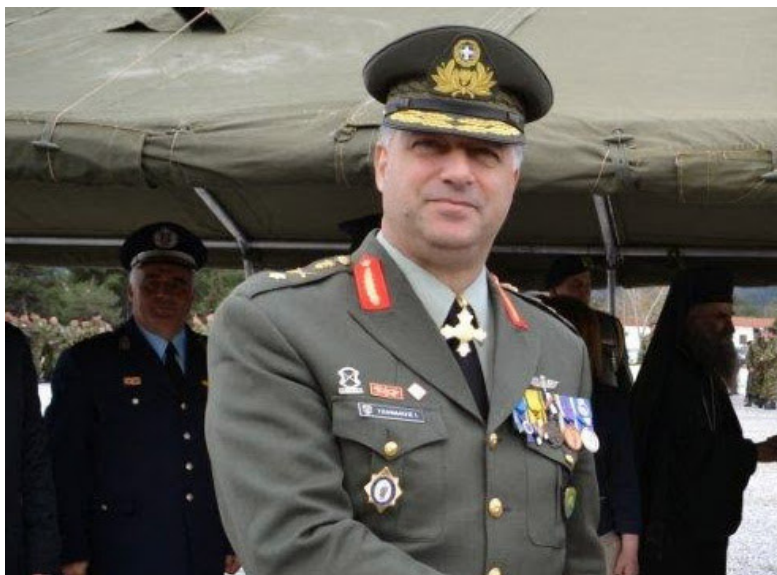
Εικόνα 14 Ο Υποστράτηγος Γιάννης Τζανιδάκης, Υποδιοικητής της 1ης ΣΤΡΑΤΙΑΣ, ένας από τους τέσσερις νεκρούς