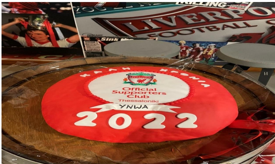
Εικόνα 6. Κοπή Βασιλόπιτας 2022 στον Σύνδεσμο