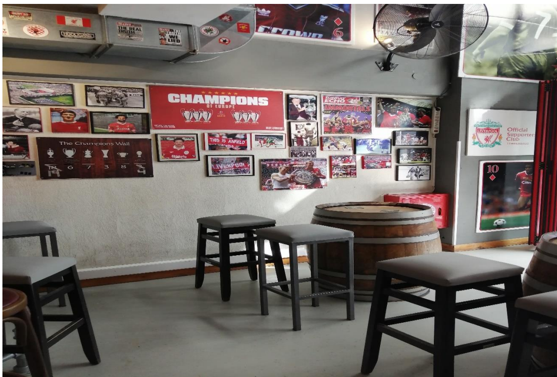
Εικόνα 3. Χώρος Συνδέσμου