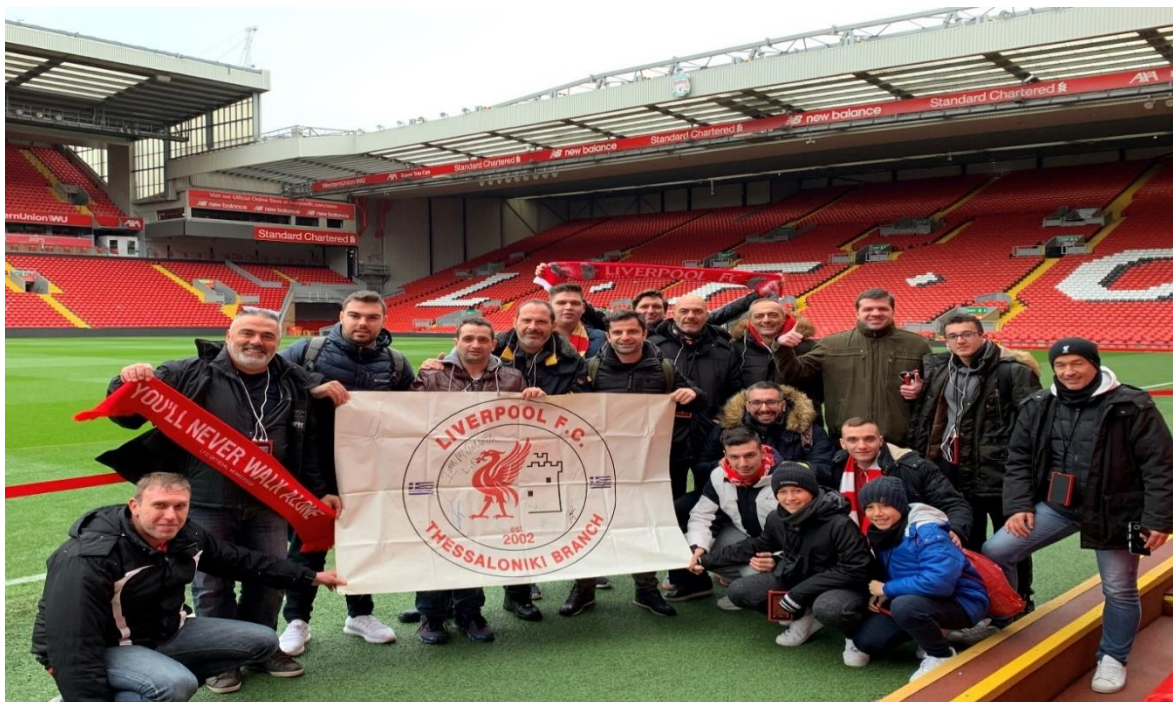
Εικόνα 7. Ταξίδι στο Λίβερπουλ (γήπεδο Anfield)