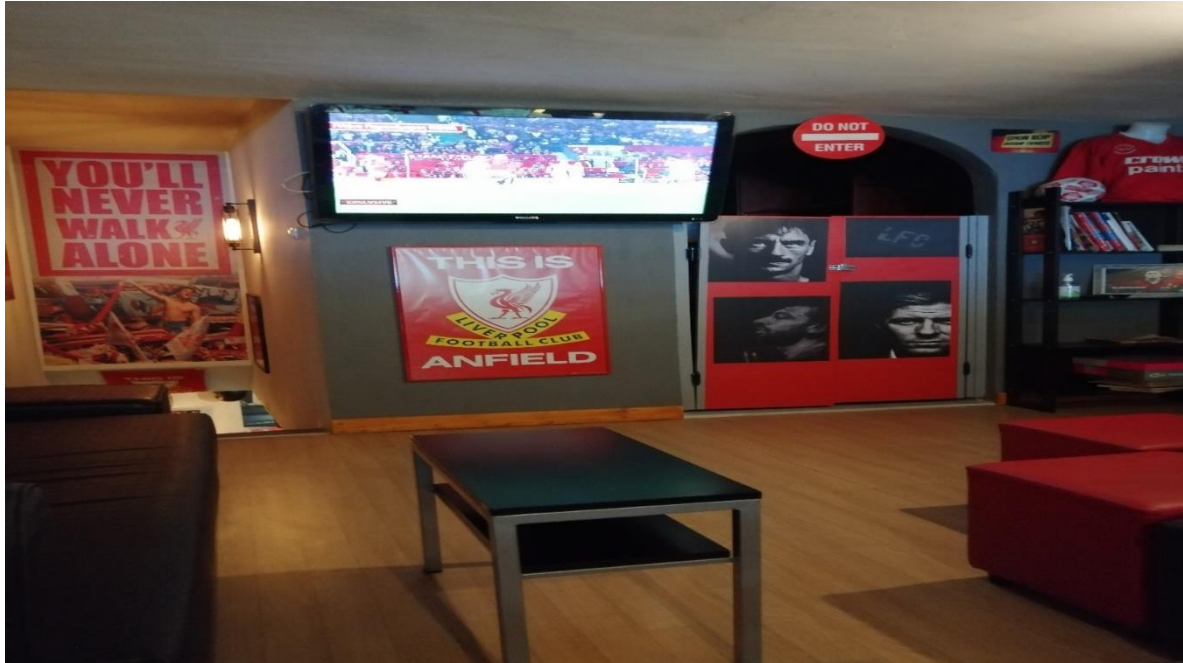
Εικόνα 1. Χώρος Συνδέσμου