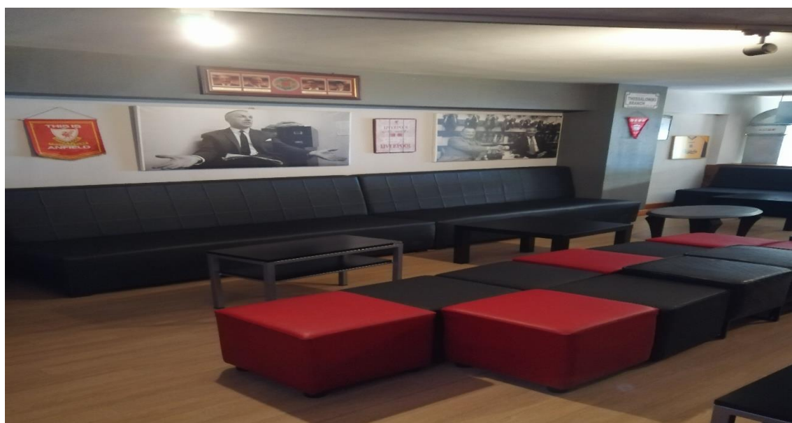
Εικόνα 4. Χώρος Συνδέσμου