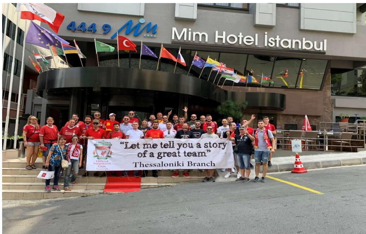
Εικόνα 8. Ταξίδι στην Κωνσταντινούπολη