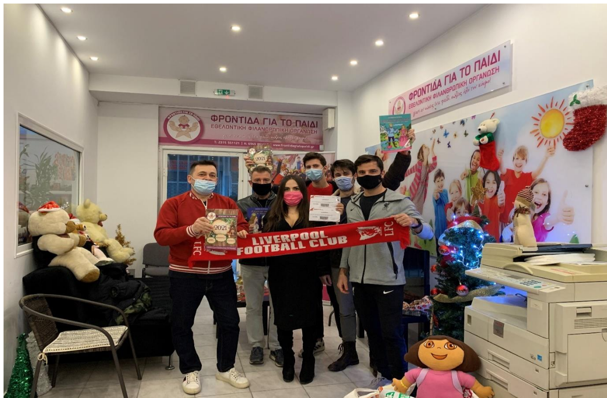
Εικόνα 5. Επίσκεψη σε Εθελοντική Φιλανθρωπική Οργάνωση (Φροντίδα για το παιδί)