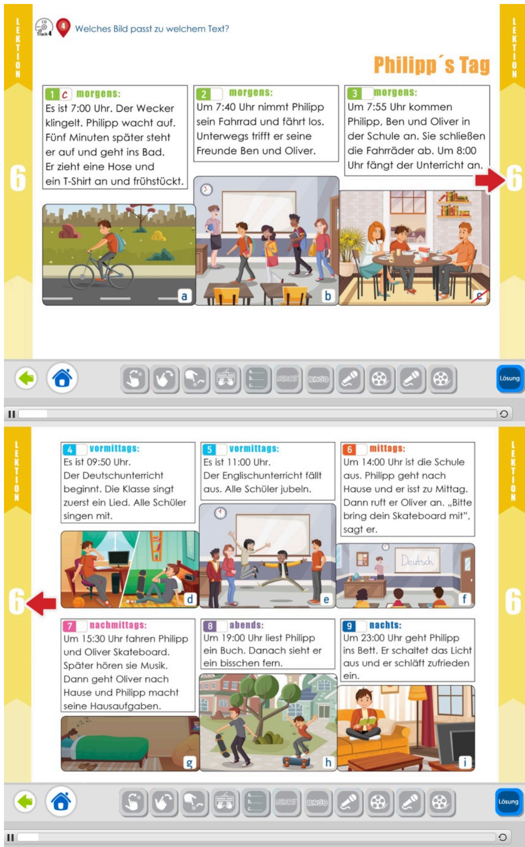
Abbildung 2: Mega A1 (interaktive Version), S. 67 (Steinadler Verlag. Online: https://www.steinadlerverlag.com/en/mega-a1-interaktiv-lektion-6-10 )