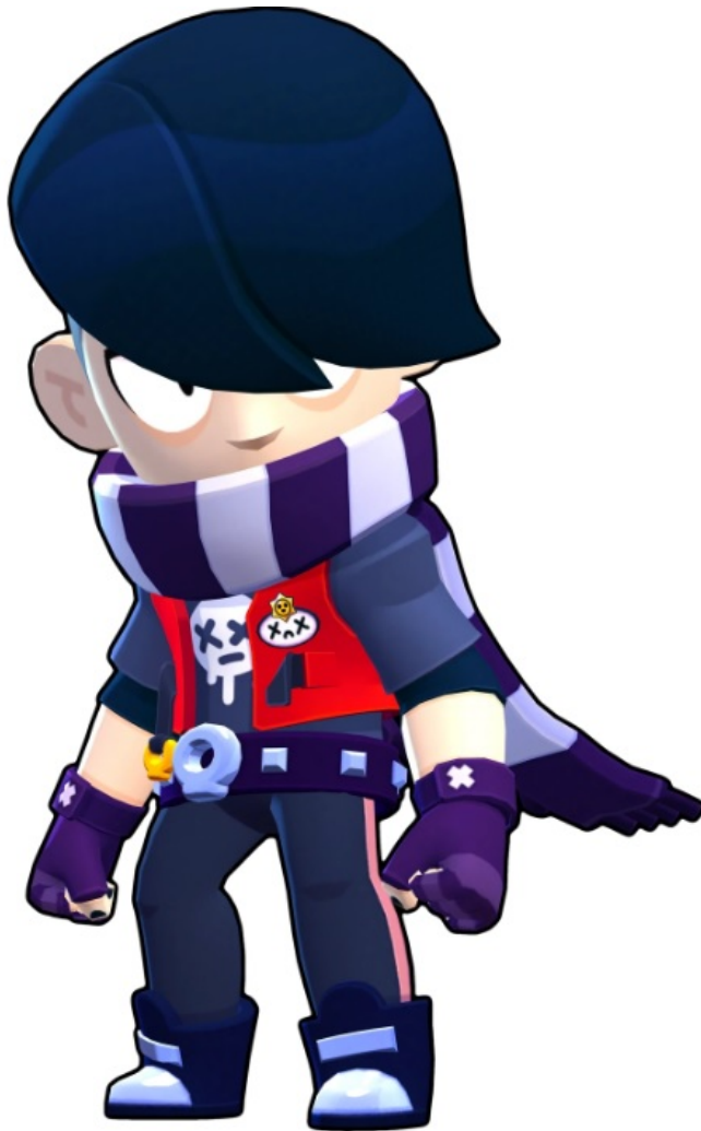
Abbildung 4: Edgar, Figur aus dem Spiel Brawl Stars (Supercell). (Online: https://brawlstars.fandom.com/wiki/Edgar )