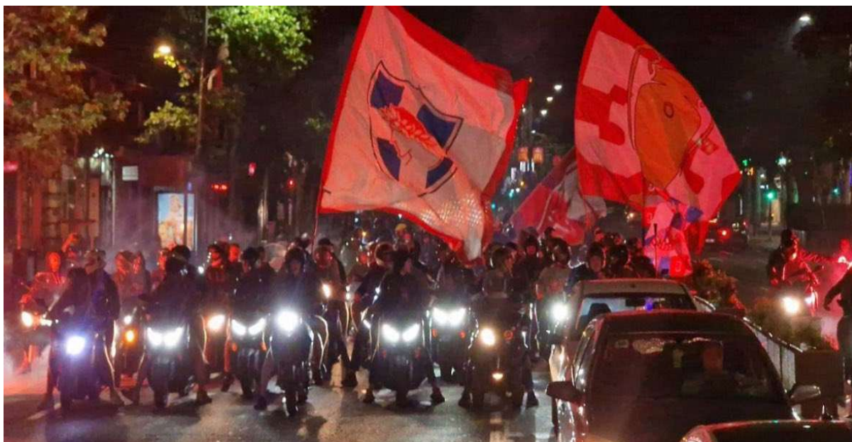
Εικόνα 19. Βελιγράδι 29/05/2024, πανηγυρισμοί οπαδών του Ερυθρού Αστήρα για την κατάκτηση του Conference League από τον Ολυμπιακό.