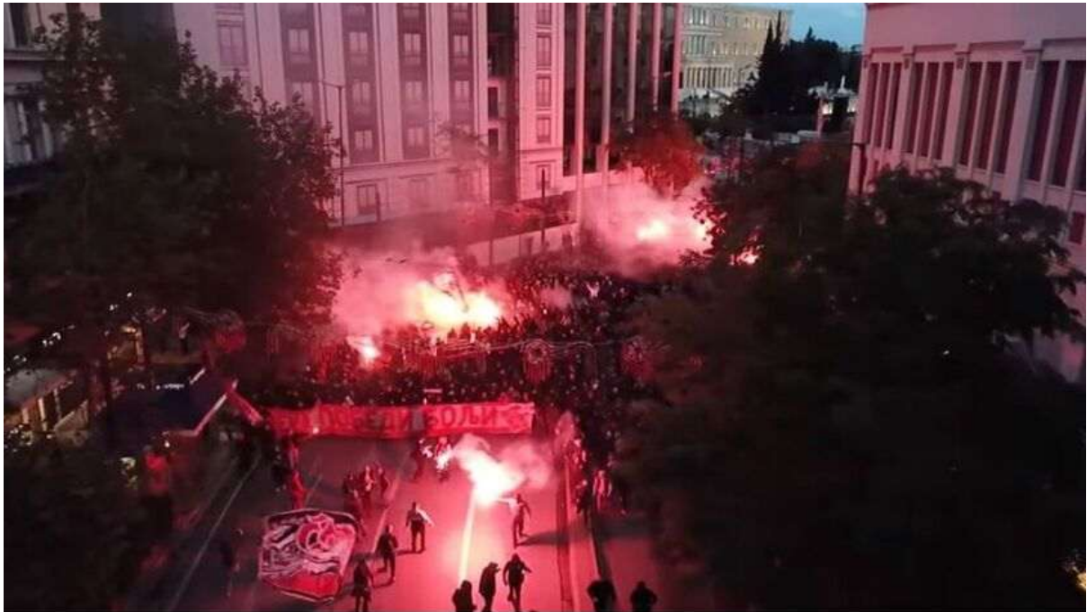
Εικόνα 11. Αθήνα 11/12/2019, κοινή πορεία οπαδών Ολυμπιακού και Ερυθρού Αστήρα από το Σύνταγμα στο γήπεδο Γ. Καραϊσκάκη.