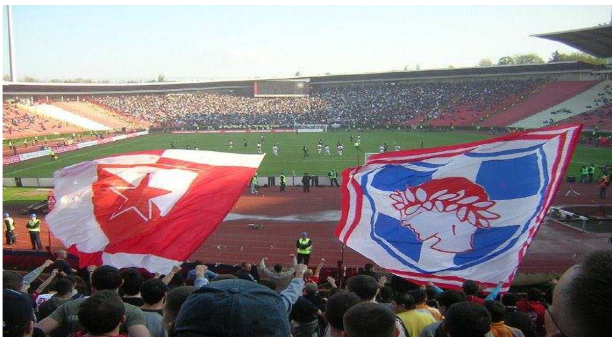
Εικόνα 3. Γήπεδο Μαρακανά οπαδοί του Ερυθρού Αστήρα και του Ολυμπιακού σε αγώνα με την Παρτιζάν.