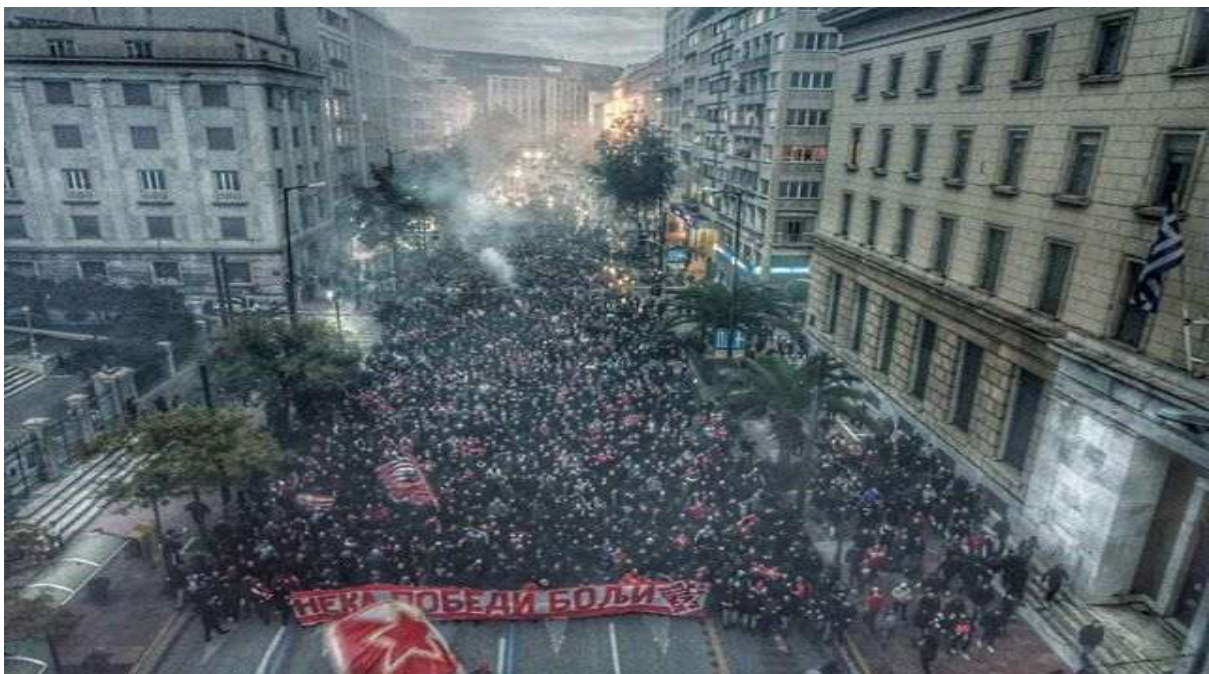
Εικόνα 12. Αθήνα 11/12/2019, κοινή πορεία οπαδών Ολυμπιακού και Ερυθρού Αστήρα από το Σύνταγμα στο γήπεδο Γ. Καραϊσκάκη.