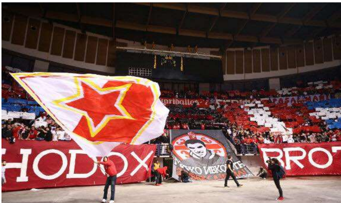
Εικόνα 16. Στάδιο Ειρήνης & Φιλίας 12/12/2014, κορεό για το παιχνίδι μεταξύ Ολυμπιακού - Ερυθρού Αστήρα.