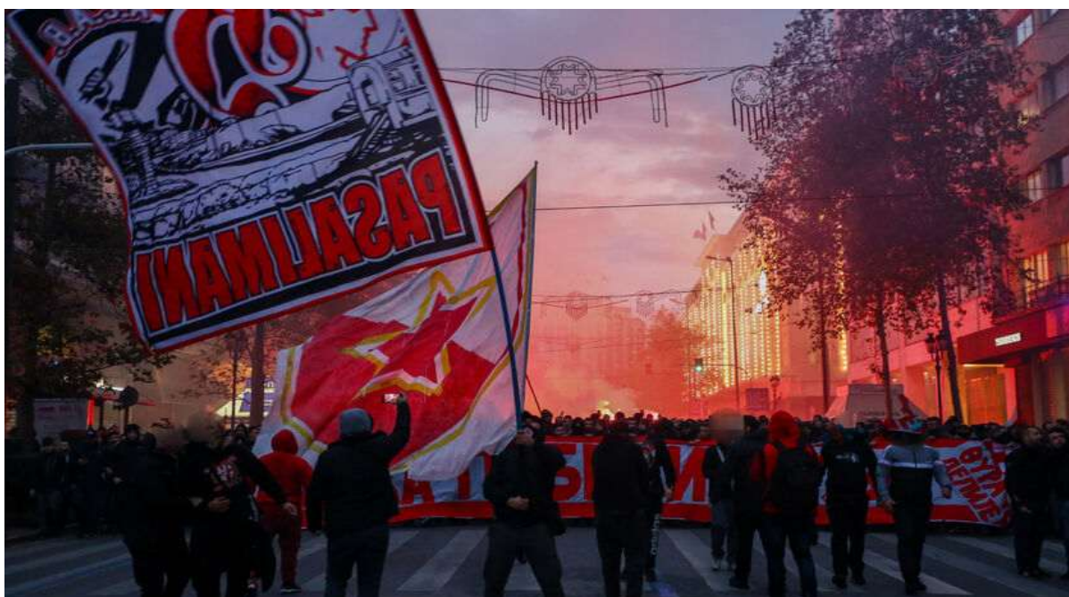
Εικόνα 10. Αθήνα 11/12/2019, κοινή πορεία οπαδών Ολυμπιακού και Ερυθρού Αστήρα από το Σύνταγμα στο γήπεδο Γ. Καραϊσκάκη.