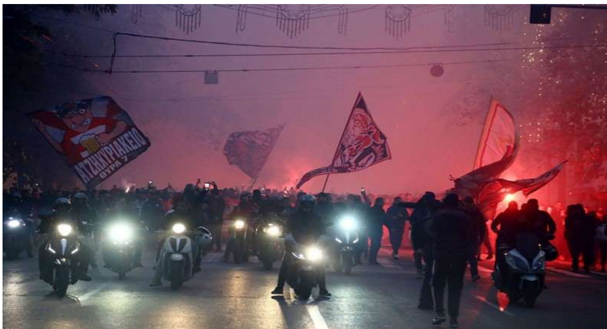
Εικόνα 14. Αθήνα 11/12/2019, κοινή πορεία οπαδών Ολυμπιακού και Ερυθρού Αστήρα από το Σύνταγμα στο γήπεδο Γ. Καραϊσκάκη.