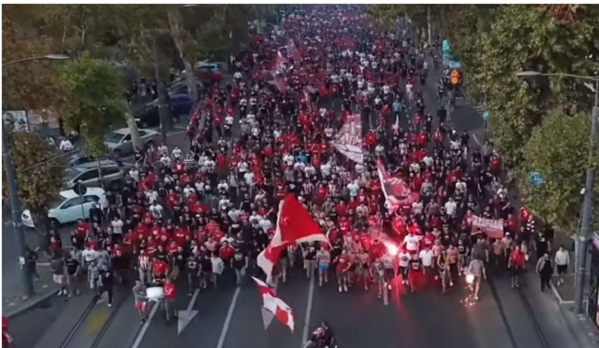
Εικόνα 8. Βελιγράδι 01/10/2019, κοινή πορεία οπαδών Ερυθρού Αστήρα και Ολυμπιακού προς το γήπεδο Μαρακανά.