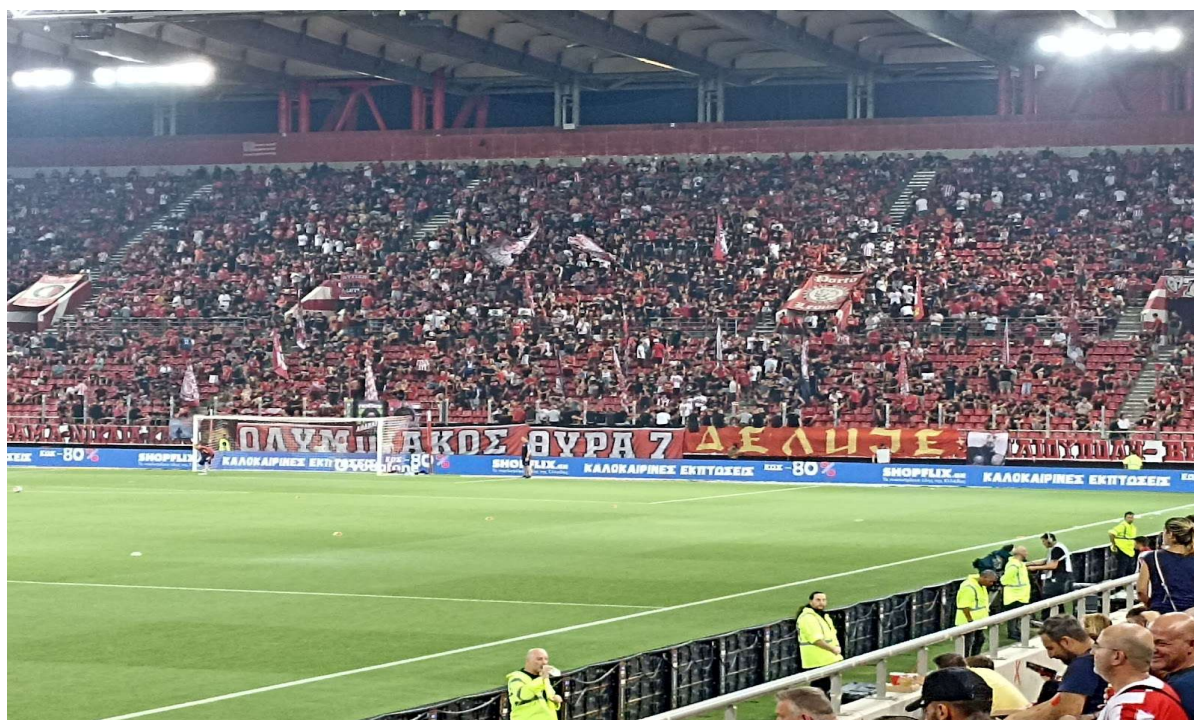
Εικόνα 18. Γ. Καραϊσκάκης 24/08/2023, κεντρικό πανό στο πέταλο για το παιχνίδι μεταξύ Ολυμπιακού - Τσουκαρίτσκι. (Πηγή: Από το προσωπικό αρχείο της ερευνήτριας)

(Πηγή: Από το προσωπικό αρχείο της ερευνήτριας)