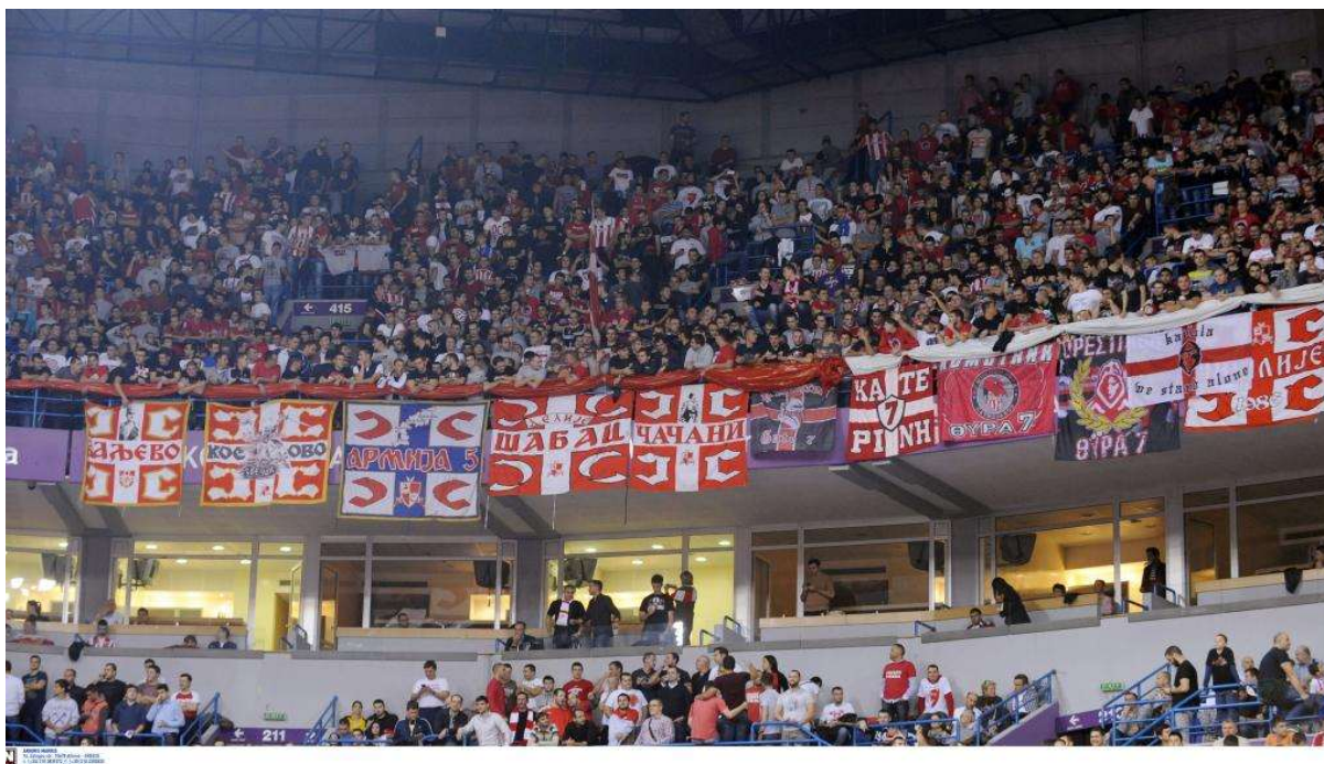
Εικόνα 6. Συνάντηση οπαδών του Ερυθρού Αστήρα και του Ολυμπιακού σε αγώνα μπάσκετ στο Βελιγράδι. (Πηγή: https://www.facebook.com/gate7officialgr/photos_by )

(Πηγή: Ερυθρός Αστήρας-Ολυμπιακός: Πώς γτίστηκε η αδερφική σχέση των οπαδών | Contra.gr )