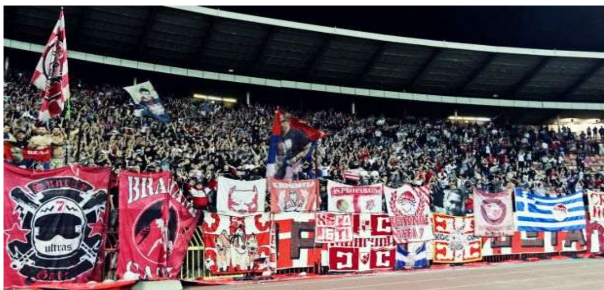
Εικόνα 2. Γήπεδο Μαρακανά 08/05/2016, φιλικό μεταξύ Ερυθρού Αστήρα- Ολυμπιακού.