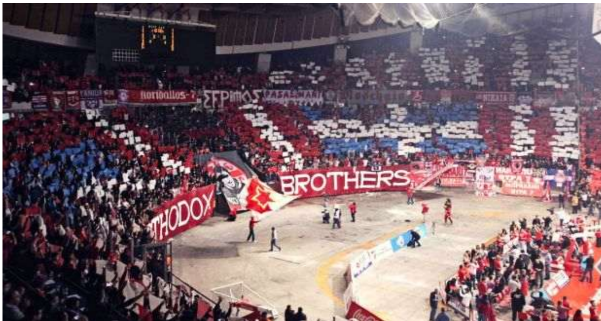
Εικόνα 5. Σ.Ε.Φ. 2014, αγώνας μεταξύ Ολυμπιακού - Ερυθρού Αστήρα για την Euroleague.