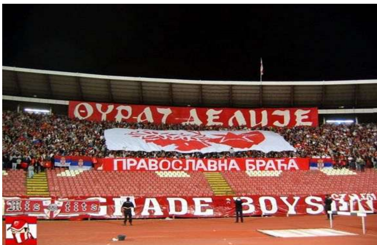
Εικόνα 22. Διάφορες συναντήσεις οπαδών σε Βελιγράδι και Πειραιά.