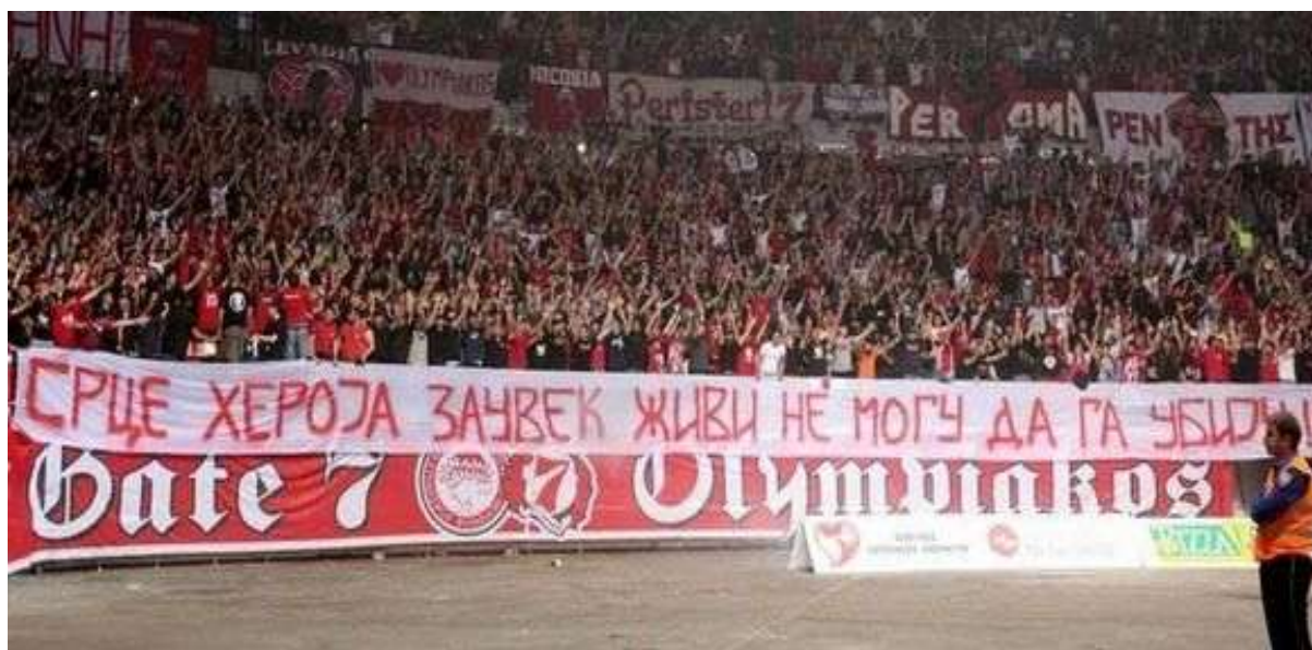
Εικόνα 21. Διάφορες συναντήσεις οπαδών σε Βελιγράδι και Πειραιά.