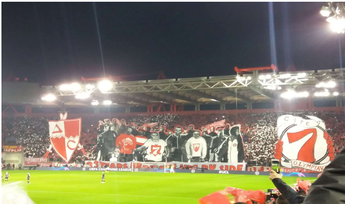
Εικόνα 15. Γ. Καραϊσκάκης 11/12/2019, κορεό για το παιχνίδι μεταξύ Ολυμπιακού - Ερυθρού Αστήρα.