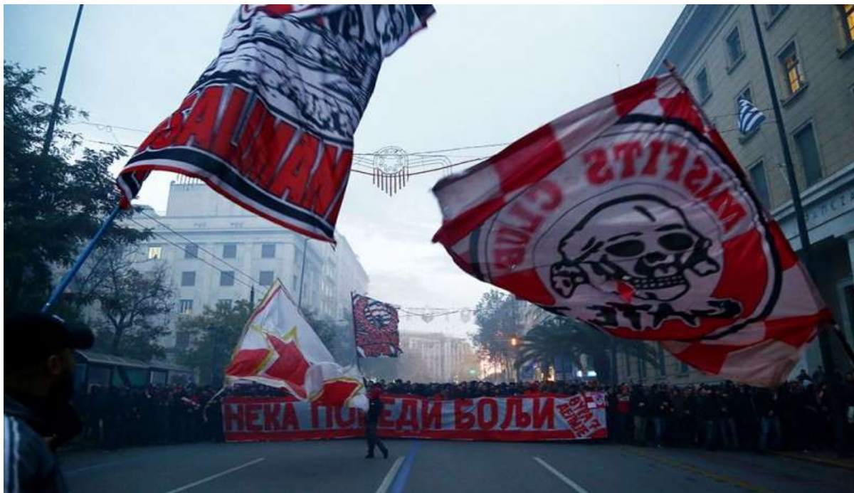
Εικόνα 13. Αθήνα 11/12/2019, κοινή πορεία οπαδών Ολυμπιακού και Ερυθρού Αστήρα από το Σύνταγμα στο γήπεδο Γ. Καραϊσκάκη.