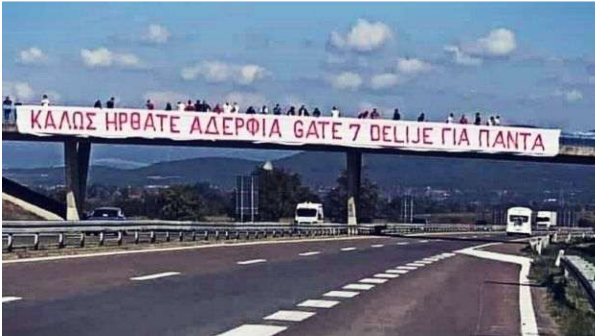
Εικόνα 7. Ε.Ο. Βελιγραδίου 01/10/2019, πανό καλωσορίσματος από τους οπαδούς του Ερυθρού Αστήρα.