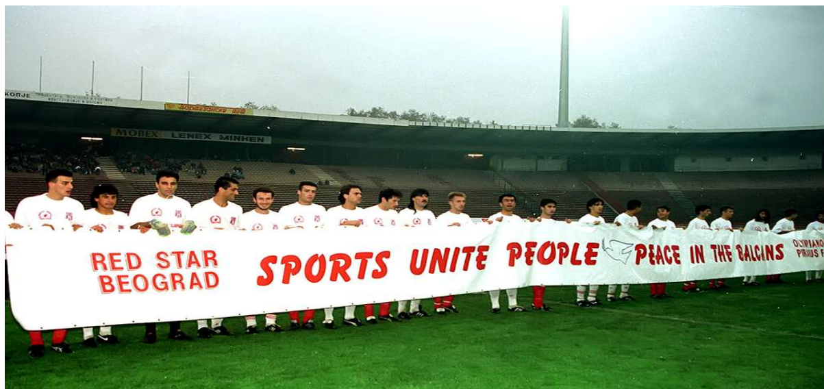
Εικόνα 1. Βελιγράδι 12/11/1994 , γήπεδο Μαρακανά, φιλικό μεταξύ Ερυθρού Αστήρα - Ολυμπιακού.