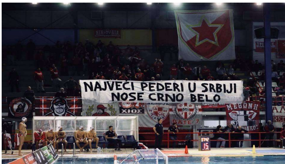
Εικόνα 4. Διάφορες συναντήσεις οπαδών σε Βελιγράδι και Πειραιά (Ολυμπιακός - Παρτιζάν πόλο αντρών 09/12/2017).