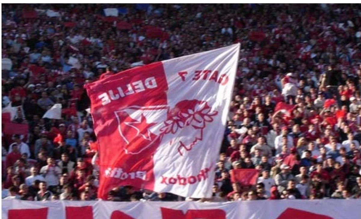
Εικόνα 20. Διάφορες συναντήσεις οπαδών σε Βελιγράδι και Πειραιά.