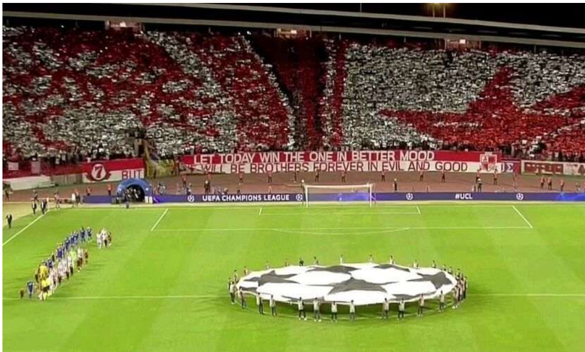
Εικόνα 9. Μαρακανά 01/10/2019, κορεό των οπαδών Ερυθρού Αστήρα.