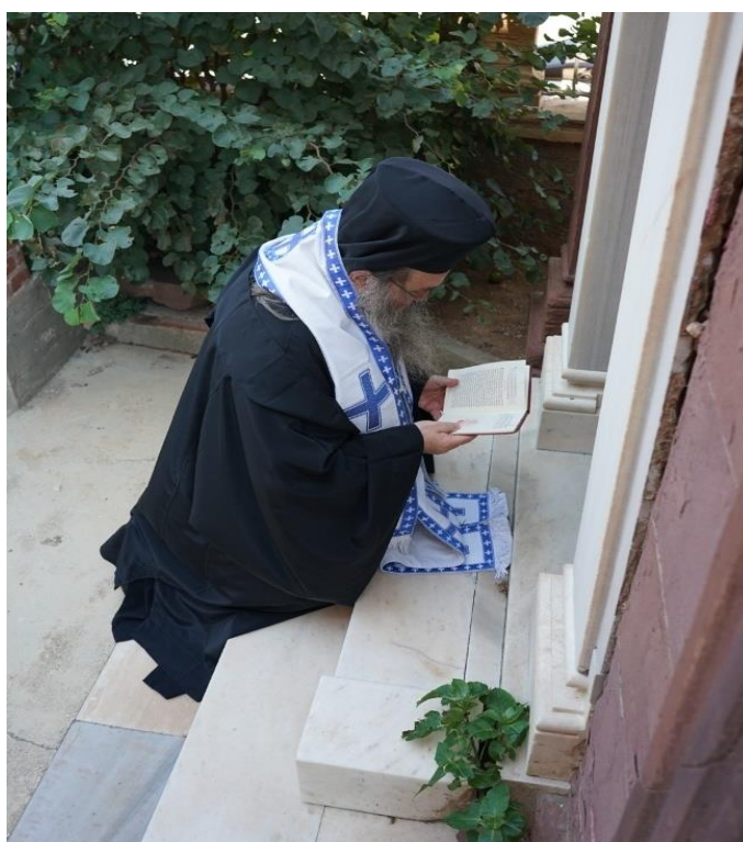
Ο Σεβ. Μητροπολίτης Χίου κ.Μάρκος, γονυπετής, στον τάφο του αιιδίμου Ιωακείμ Στρουμπή, τελεί επιμνημόσυνη δέηση, για την αποκατάσταση του Προκατόχου του, από την Ιερά Σύνοδο της Εκκλησίας της Ελλάδος. (2021)