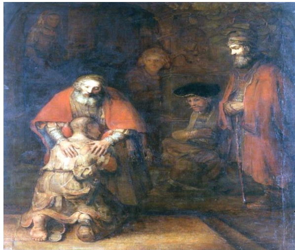
«Η επιστροφή του ασώτου υιού» του Rembrandt.