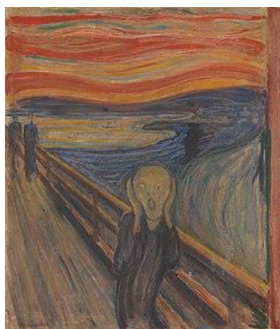
«Κραυγή» του Έντβαρντ Μουνκ

Κατά την πρώτη μου νεότητα, ο πίνακας του Μουνκ «Η Κραυγή », ένας από τους πιο αναγνωρίσιμους πίνακες στην ιστορία της τέχνης, δεν είχε να μου κομίσει κάποιο σημαντικό νόημα που να αφορά την εσωτερικότητά μου. Ήταν μια εποχή που το μέλλον απλωνόταν μπροστά μου ελπιδοφόρο και δεν είχα ιδιαίτερες υπαρξιακές αγωνίες να με ταλαιπωρούν. Όπως ο άσωτος υιός της γνωστής παραβολής του Χριστού, ανυπομονούσα κι εγώ να εγκαταλείψω την πατρική εστία και να ζήσω ανεξάρτητη και ελεύθερη. Πηγαίνοντας σε πόλη μακρινή, άρχισα να απολαμβάνω την κοσμική ζωή της πρωτεύουσας δίχως ιδιαίτερες έγνοιες. Οι συνθήκες, όμως, άλλαξαν, λόγω της οικονομικής κρίσης, και όπως ήταν επόμενο, κατά την σκληρή περίοδο των μνημονίων, μου χτύπησε την πόρτα η ανεργία, η οικονομική δυσπραγία και η δυσκολία στην αντιμετώπιση των διαπροσωπικών μου σχέσεων. Το υπαρξιακό μου αδιέξοδο δεν άργησε να αναδυθεί και η κραυγή που έβγαινε από μέσα μου έμοιαζε με αυτή του απομονωμένου και εσωτερικά ερημωμένου ατόμου του γνωστού πίνακα. Ξεκίνησε τότε ένα ταξίδι αυτοανακάλυψης για εμένα, ένας δρόμος που, όπως επιτυχώς επεσήμανε στο ομώνυμο βιβλίο του ο γνωστός ψυχίατρος Σκοτ Πεκ, είναι ο λιγότερο ταξιδεμένος. Η κατάληξη υπήρξε ευτυχής, όπως αντίστοιχα και στην παραβολή του