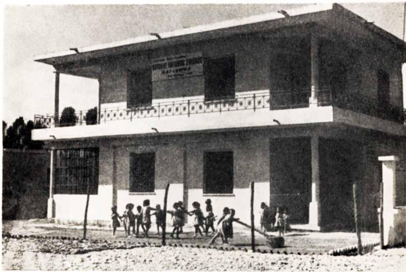
Ο Εθνικός Παιδικός Σταθμός, 1961 104

σημαντικό έργο και με την ίδρυση του Εθνικού Παιδικού Σταθμού, που παρείχε στέγη, τροφή αλλά και ψυχαγωγία 102 , για την ελάφρυνση των εργαζόμενων μητέρων. Επίσης, προς την κατεύθυνση της ενίσχυσης των γυναικών της Μητρόπολης, ίδρυσε την Οικοκυρική Σχολή για την επαγγελματική αποκατάσταση κοριτσιών που προέρχονταν από αγροτικές οικογένειες 103 .