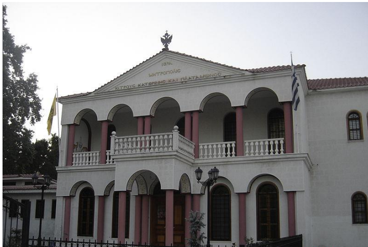
Μητροπολιτικός Οίκος στην Κατερίνη 71

εγκαταστάσεις, με σκοπό την εξυπηρέτηση οργανωτικών και λειτουργικών θεμάτων της Μητρόπολης 70 .