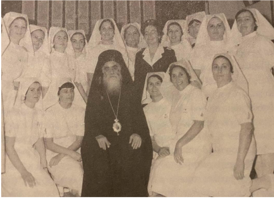
Ο Μητροπολίτης Κίτρους Βαρνάβας Τζωρτζάτος με τις αδελφές νοσοκόμες του Ε.Ε.Σ. 116