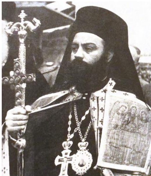
Η ενθρόνιση του Μητροπολίτη Κίτρους, Βαρνάβα Τζωρτζάτου 36

Την εποχή της ενθρόνισης του νέου Μητροπολίτη, η Μητρόπολη Κίτρους χρειαζόταν μεταρρυθμίσεις, πρωτοβουλίες και πνευματική καθοδήγηση, καθώς είχε θρησκευτικά προβλήματα και τεράστιες ανάγκες ποιμαντικής δράσης. Έτσι, ο Μητροπολίτης Βαρνάβας αποτέλεσε τον κατάλληλο πνευματικό ηγέτη, όντας δυναμικός, γεμάτος ζωντάνια και ευφυΐα. Χαρακτηριστικής σημασίας, για την βαθύτερη κατανόηση της δέουσας ανάγκης για καθοδήγηση που έφερε η Μητρόπολη, είναι τα λόγια του Διευθυντή της Αποστολικής Διακονίας και καθηγητή του Πανεπιστημίου Αθηνών, Βασίλειο Βέλλα κατά την ενθρόνιση του Βαρνάβα. Συνοπτικά και περιφραστικά θα αποτυπωθούν τα λόγια του προς τον Μητροπολίτη Βαρνάβα, τα οποία τονίζουν τα προβλήματα που αντιμετώπιζε η Μητρόπολη παρομοιάζοντάς τα ως «άκάνθινον στέφανον καί τοῦ ὁποίου τά ἀγκάθια γρήγορα θά αισθανθῆς», και